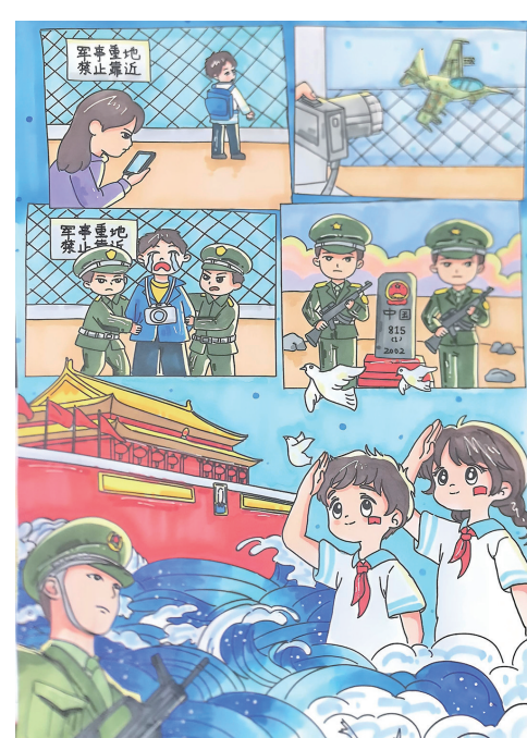
法治护航 健康成长 中卫市第十小学五(2)班 张曼珂 指导教师 王紫薇

本期作品为“青少年法治援助行动”《我心中的法治》栏目入选作品,作品由中卫市关工委、教体局支持提供。