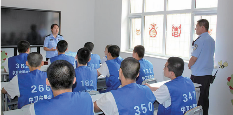
近日,中卫市公安局刑侦支队民警紧扣“防范药物滥用 提升识毒防毒拒毒意识”主题,聚焦实效性,深入中卫市看守所开展禁毒专题教育活动。

下一步,海原县公安局将持续深入开展各类安全宣传培训活动,创新宣传形式,丰富宣传内容,扩大宣传覆盖面,将更多实用的安全知识送到群众身边。