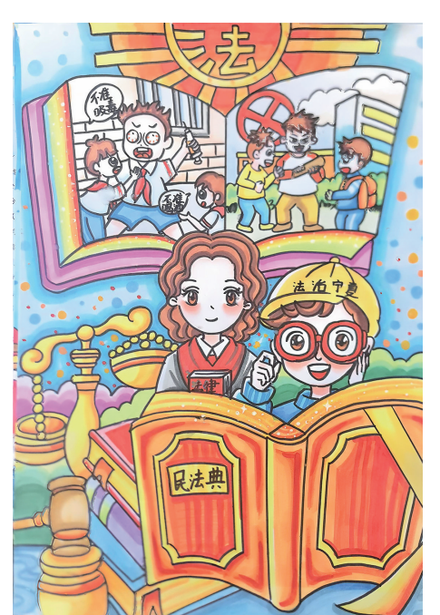
我心中的法治 中卫市第十小学三(2)班 王雅彤 指导教师 何玉岗