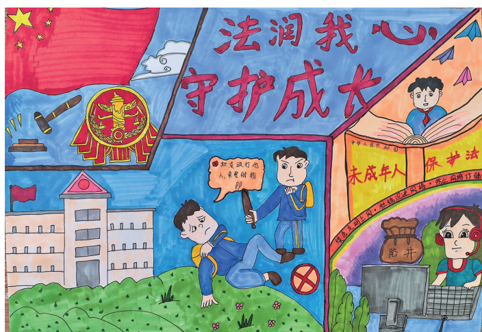
法润我心 守护成长 中卫市第十小学四(2)班 高希尧 指导教师 魏兰