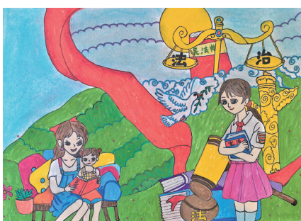
法治伴我成长 中卫市第十小学四(2)班 王雪怡 指导教师 魏兰

法治点亮美好世界。法治让我们的世界有了运行的规则,让社会充满了安全、公平和秩序。在这个法治守护的世界里,我们小朋友才能安心学习、快乐成长。让我们一起学法,成为知法懂法的社会主义接班人。