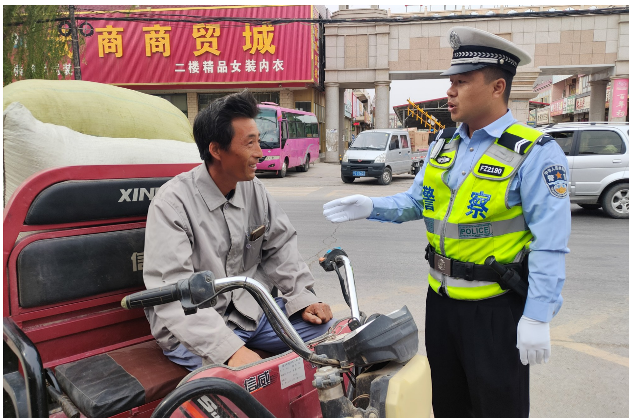
中卫交警在农村地区开展交通安全宣传教育。

中卫交警积极推动道路交通安全隐患排查治理工作，联合交通运输、应急管理及各乡镇政府，对辖区临水临崖、急弯陡坡、平交路口等事故多发路