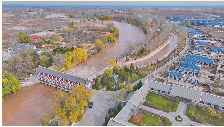
11月中旬，冬灌进入黄金期。