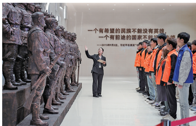
未成年社区矫正对象接受红色教育。

说教，而是耐心讲解交通安全的重要性，让他真正理解了“法律是保护而非约束”。从此，他变得主动学习法律知识，积极完成矫正要求。