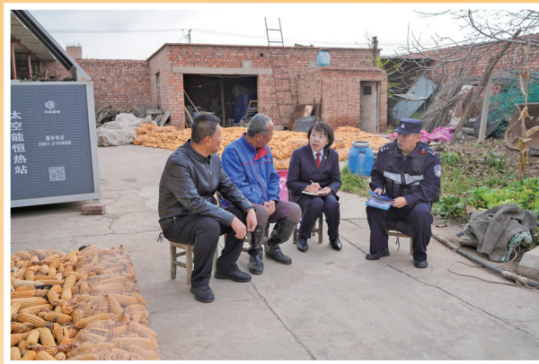
深入辖区农户家中征集意见建议，为冬季灌溉保驾护航。