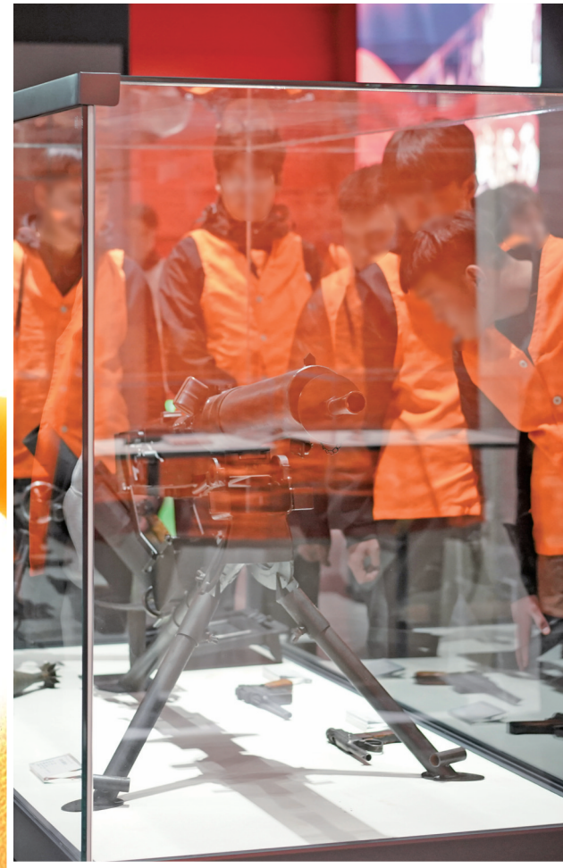
未成年社区矫正对象参观边学习。

“未成年矫正对象本质上还是年轻人，要让他们多接触社会，通过社会实践和公益活动，在潜移默化中树立正确价值观。”吴忠市司法局副局长郭春晖介绍，成立未成年社区矫正工作专班，正是坚持“教育、感化、挽救”方针，以爱心代替高压监管，以专业化解成长难题。