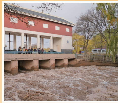
渠道的安全畅通，离不开多部门的协同发力。

点”，往年只能在灌域大部分用水完成后抢灌。今年，宁夏水利部门实施大清渠改造工程，针对河西总干渠和大清渠张岗渠渠系两侧的历史遗留问题和私搭乱建问题开展重点整治。