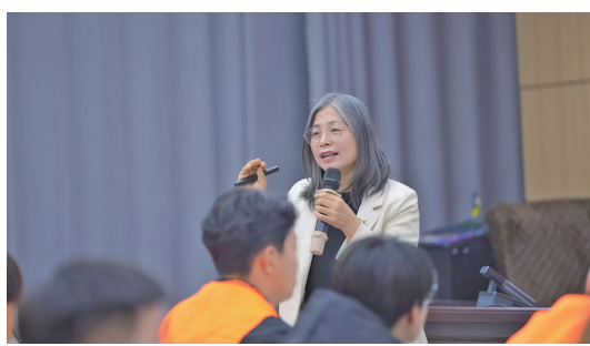
专业心理老师为未成年社区矫正对象开展团体心理辅导。