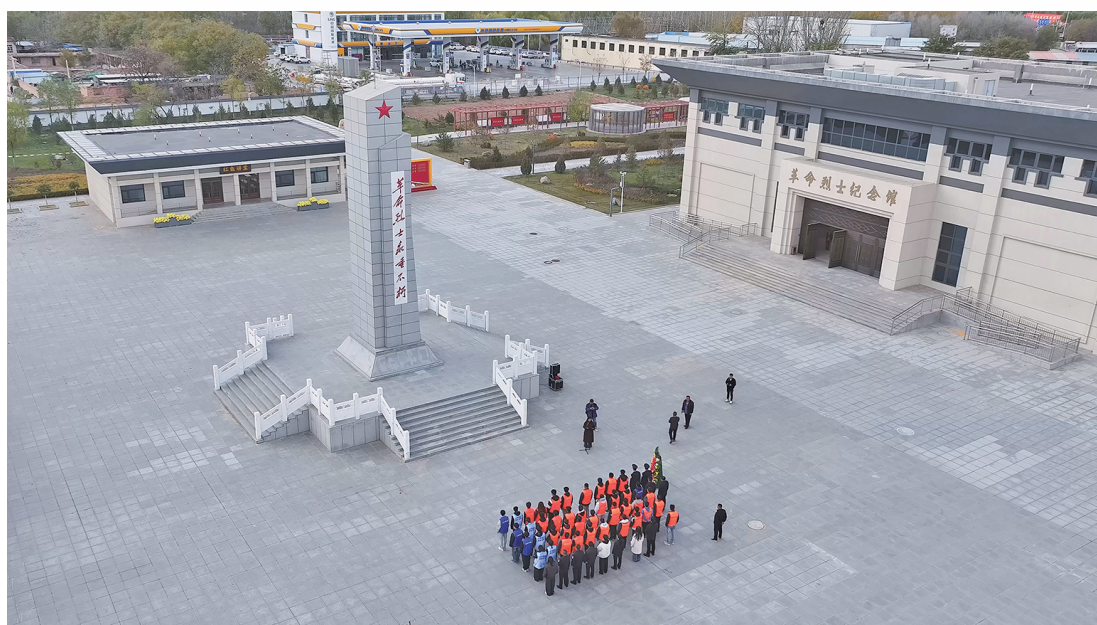
吴忠市司法局组织干警与未成年社区矫正对象来到任山河烈士陵园纪念碑前敬献花篮，缅怀革命先烈。