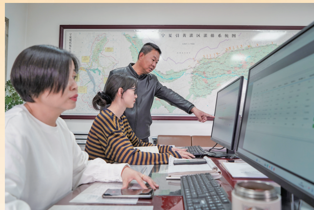
智慧化指挥平台精准调配水资源。

“眼看冬灌都快结束了，还有几百亩地没淌完，这可咋办？”这是灌域村民老黄去年反映的难题。该村地处大清渠稍段，供水一直是“难