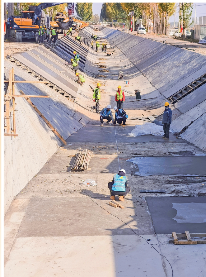
宁夏渠首管理处工作人员定期对辖区渠道开展安全巡查巡护。