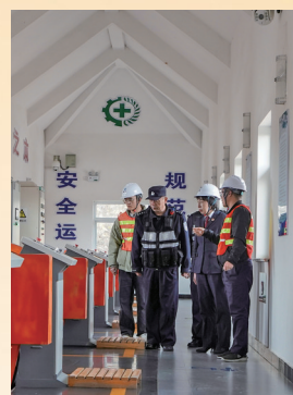
在宁夏渠首管理处大坝所，工作人员详细介绍分水闸运行情况。