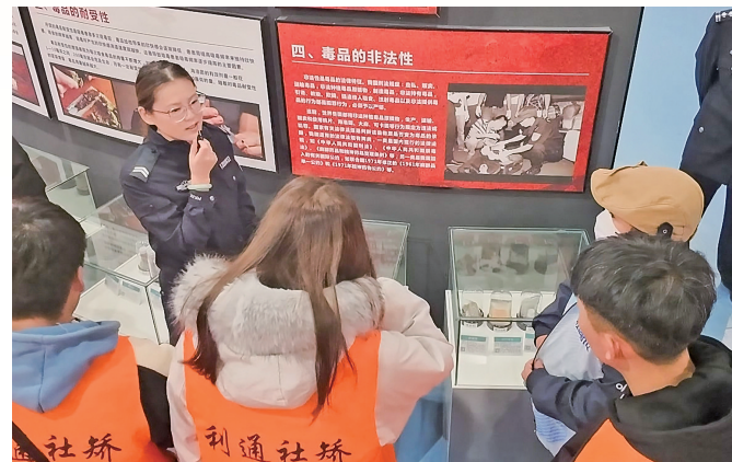
吴忠市禁毒教育基地内，禁毒干事为未成年社区矫正对象专题讲解毒品危害。