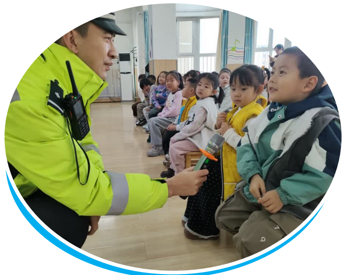
12月2日，银川市金凤区满城北街街道平伏桥村联合金凤区交警一大队走进金凤区悦湖幼儿园，通过“交通手势舞”和小游戏，让60余名萌娃沉浸式学习交通规则。

12月2日清晨7时30分起，一场持续10余个小时的“行走的交通安全课”在全国多平台同步直播，拉开第十四个国家交通安全日宁夏主题活动的序幕。当天，各级公安交管部门以“交通安全课+特色主场活动+全天超长时段直播”的创新形式多元呈现，全方位、多角度传递出“文明交通 礼行天下”的交通安全理念。