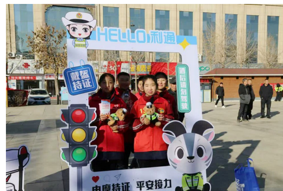
在吴忠交警举办的交通安全知识问答中，拿到奖品的孩子们高兴地打卡合影。

十四载初心如磐，守护一路平安。自2012年首个“全国交通安全日”设立以来，宁夏交警始终紧扣年度主题，结合地域特色，持续深化交通安全宣传教育。此次第十四届“全国交通安全日”系列活动期间，各地各部门持续创新宣传形式、丰富传播内容，推动文明交通理念深入人心、践之于行，为建设安全、畅通、文明、和谐的道路交通环境注入持久动力。