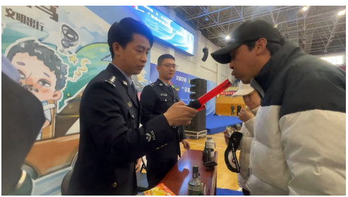
在宁东交警大队的活动现场，群众体验酒精检测仪。