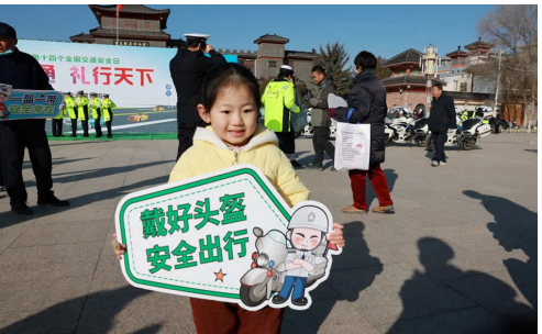
在固原交警举办的主题活动中，萌娃也来参与交通安全宣传。

“骑电动车拐弯要看路况，主路上车速都快，咱可不能把马路当成自家院子，想咋走就咋走……”12月2日正值平罗县宝丰镇赶集日，来往群众络绎不绝。民警围绕农村群众日常出行高频交通风险点，用接地气的家常话、直白易懂的表述，向群众细致讲解交通安全知识，从骑乘电动车佩戴安全头盔、驾乘机动车系好安全带的基础防护常识，到过马路遵守信号灯、不逆行、不占道的通行规则，再到冬季出行防寒防滑、避让大型车辆的注意事项，一一讲解到位，让群众听得清、听得懂、用得上。