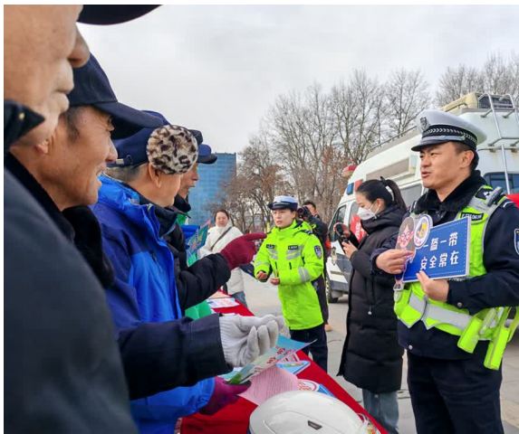
在石嘴山市大武口区和平广场，民警向群众宣传“一盔一带”的重要性。