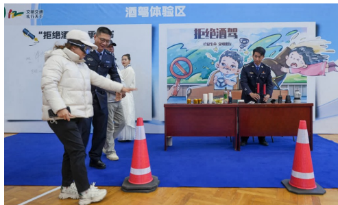
在宁东交警大队的活动现场，群众佩戴VR眼镜感受酒驾的危险性。

《信任的长河》以经典儿歌《一分钱》为线索，展现了警民之间深厚的信任与坚守；主题演说《宁夏交警“她”力量》刻画了女交警细腻而坚韧的职业形象；穿越情景剧《交警版《西游记》》及小品《礼行天下》以幽默方式普及交通法规；全景讲述《让遗憾不再重演》通过真实案例揭示交通违法的沉重代价，引人深思；情景诗画《学武之路》与男声小合唱《人间正道》深情致敬因公牺牲交警王学武，现场感人至深；街采集锦《我心中的交通》邀请网红交警与网络达人与大学生互动，气氛热烈；由学生演绎的歌舞《礼行天下，从我做起》更以青春姿态点燃文明出行热情。