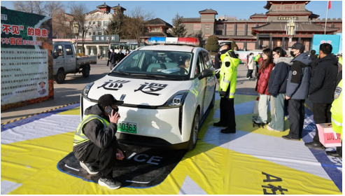
在固原交警的引导下，群众亲身体验汽车盲区的隐蔽危险。