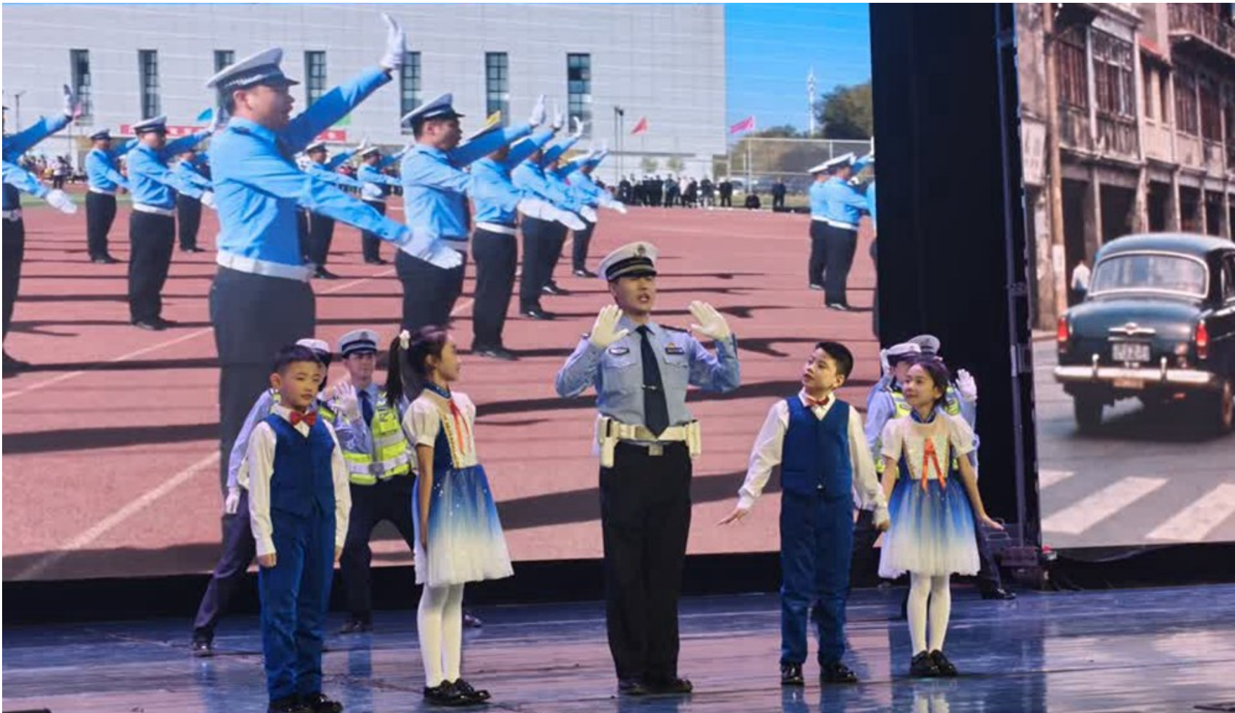
←12月2日，在全国交通安全日宁夏主题活动中，情景剧《一分钱》引发观众共鸣。