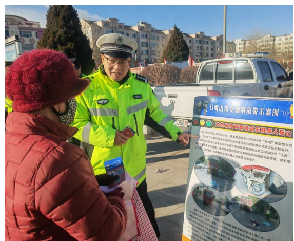
在石嘴山市惠农区文景广场，民警向群众讲解事故案例。