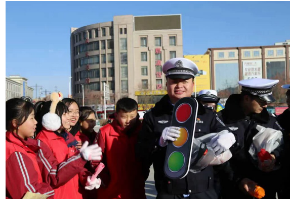
在吴忠交警的发动下，学生们积极参与交通安全知识问答。