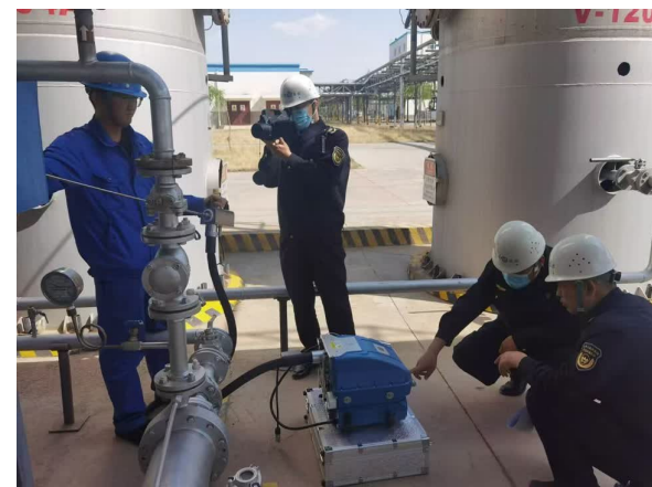
执法人员在企业现场执法检查。

贺兰山生态修复工程是另一个生动例证。宁夏生态环境部门积极推动将该项目列入国家山水林田湖草沙一体化保护和修复工程，通过开展整体保护、系统修复、综合治理，区域生态环境质量明显改善。如今的贺兰山，森林覆盖率稳步提升，岩羊等野生动物种群数量呈现增长趋势。