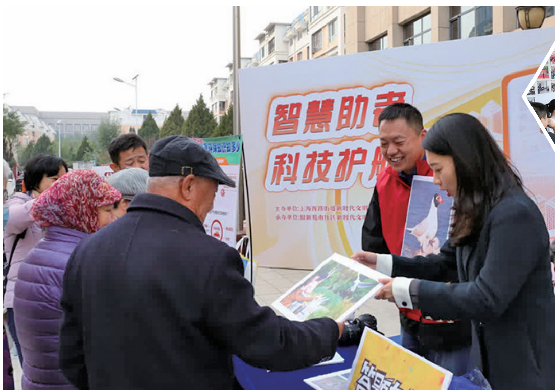
生态环境志愿者进社区宣传。

据了解，在环评审批领域，生态环境部门持续推进效能革命。建立“三本台账”和绿色通道，审批时限压缩50%；23个审批部门全流程网办、企业“零跑动”；专家上门服务，为项目“把脉问诊”。今年以来，全区共完成一般建设项目环评文件审批775个，总投资超1876亿元。另外，排污权交易改革的深化，更让企业尝到了甜头。生态环境部门创新推出小排放量项目简易出让方式，单项污染物排放量较小的建设项目可通过“随到随办”方式获得排污权，有效提升了交易效率。改革开展以来，全区完成交易944笔、1.07亿元，2025年1-10月，二级市场交易笔数同比增长136%。碳市场建设成效显著，生态环境部门推动41家发电行业重点排放单位参与全国碳排放配额交易，成交3817.92万吨，成交金额25.86亿元。随着今年新纳入21家重点排放单位，覆盖二氧化碳管控排放量从67%跃升至80%。