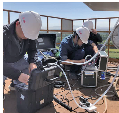
生态环境监测技术人员进行废气污染源监测。

严格管控涉企检查频次。2025年1-10月，全区不予行政处罚32件，让执法既有力度，更有温度。