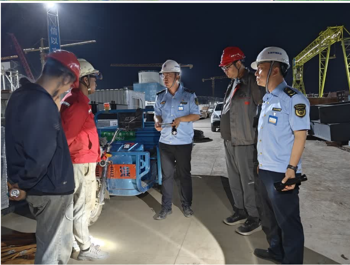
执法人员夜查高风险移动放射源探伤作业现场。