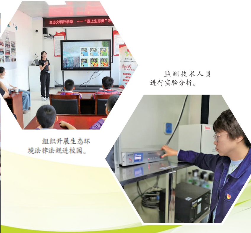
监测技术人员进行实验分析。

在这片希望的的土地上，法治的力量将继续守护着每一寸绿色，书写着人与自然和谐共生的美好篇章。宁夏生态环境部门将以更加完善的法治体系、更加规范的执法行为，更加优化的营商环境，为深入打好污染防治攻坚战、推进美丽宁夏建设贡献生态环境力量。