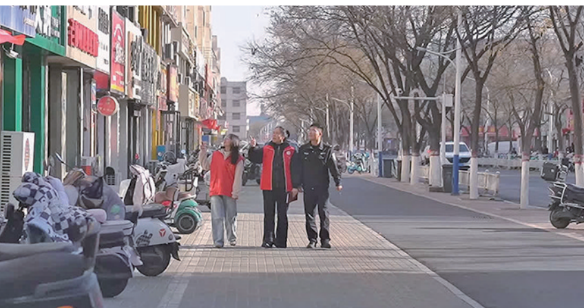
社区民警与网格员常态化开展巡逻。