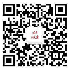
宁夏法治报微信公众号

近日,顺丰速运石嘴山分公司星海湖营业部快递小哥咸阳一早来到石嘴山市公安局,等待他的是一份特殊的“奖励”。