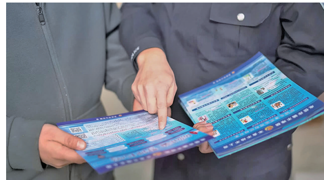
民警向辖区居民宣讲反诈知识。