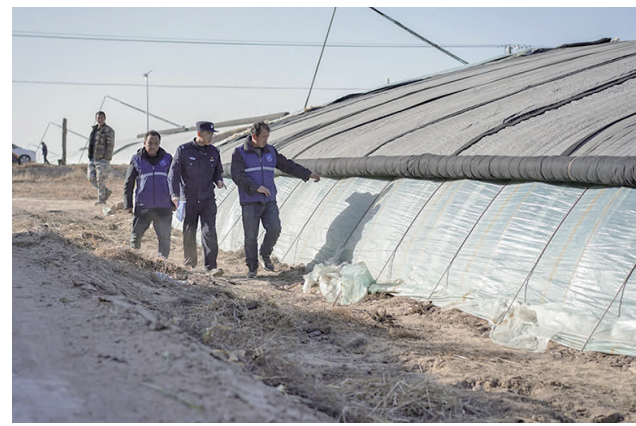
崇兴镇上滩村治保委联合派出所民警,在辖区开展定时巡逻。

跟踪督办等职能,成为高效运转的“总开关”。今年以来,郝家桥镇依托“混合编组”机制,成功处置矛盾纠纷排查386件,化解381件,化解率98.7%。棚外寒风料峭,棚内绿意盎然。一茬茬鲜嫩的韭菜从松软的土壤中探出头,既承载着种植户对丰收的期盼,也书写着灵武政法综治力量赋能乡村振兴的不懈实践。