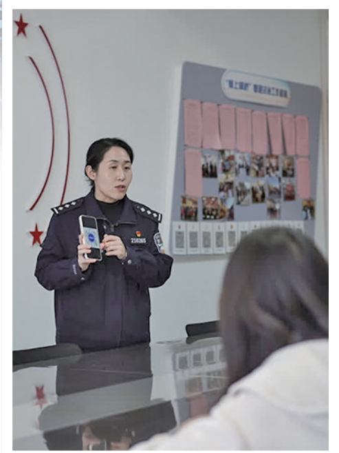
社区民警通过培训,助力“社会信息员”成为平安建设的“千里眼”和“顺风耳”。