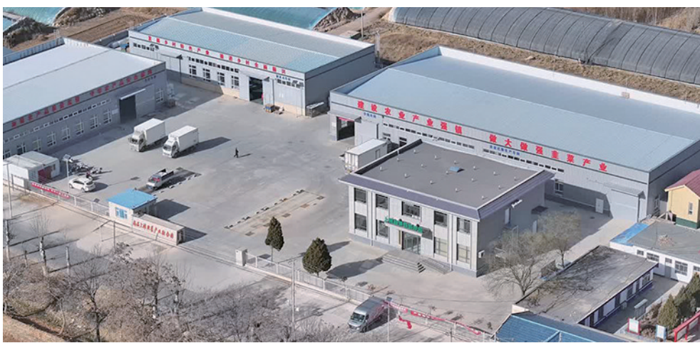
灵武市郝家桥镇上滩村形成了以设施农业、蔬菜加工业为主的经济发展方向。