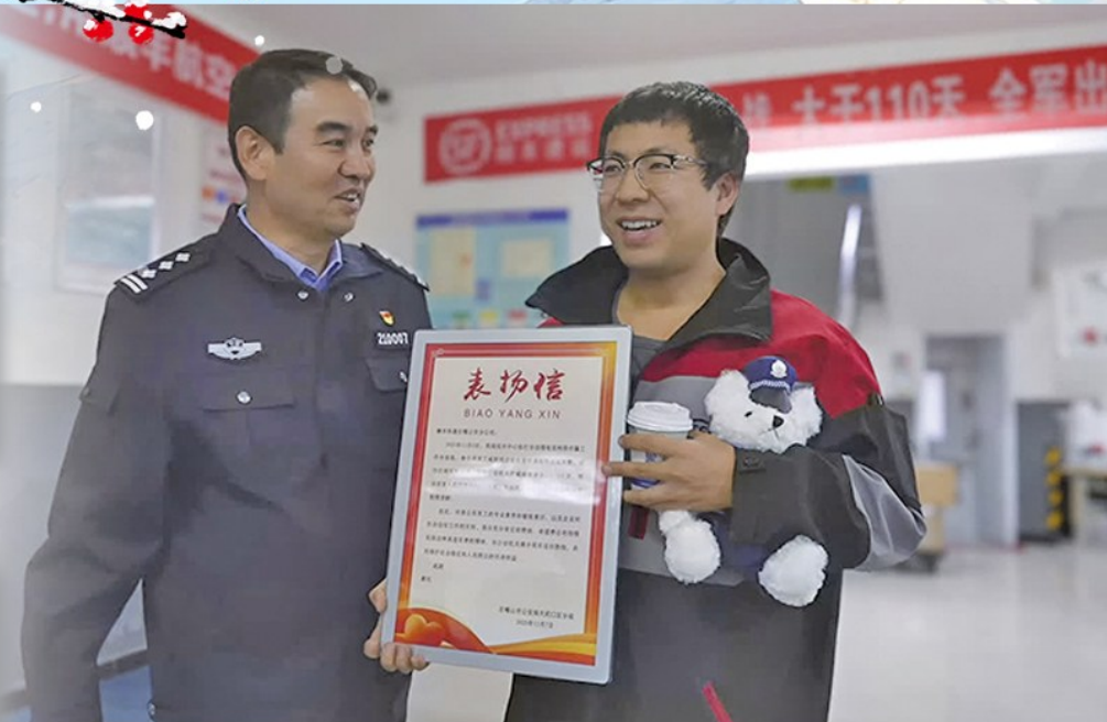
石嘴山公安对有重大发现的社会信息员予以奖励。