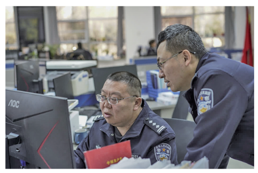
情报指挥中心民警对信息来源及价值开展分析研判。