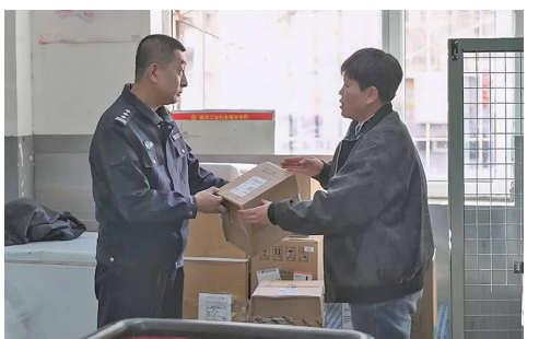
石嘴山市公安局询问快递驿站工作人员来往快递是否存在异常。