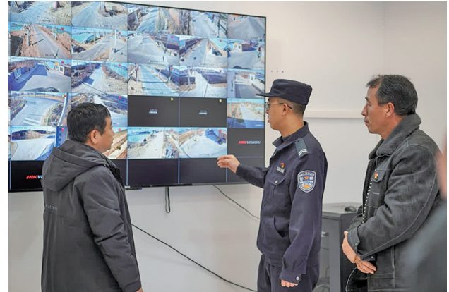
排查辖区动态,精准研判风险隐患。