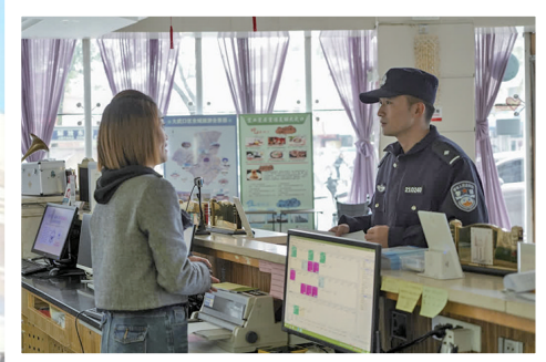
民警收集并核实信息。

“警力有限,民力无穷,发动群众、依靠群众方能织密群防群治安全网。”王海峰表示,石嘴山市公安局将不断拓宽线索收集渠道,利用快递员、出租车司机、环卫工人、沿街商户、社区居民等不同群体的“火眼金睛”,织密平安石嘴山的“天罗地网”,使他们真正成为公安机关的“千里眼”和“顺风耳”,用点滴行动汇聚平安力量,用共同参与守护美好家园。