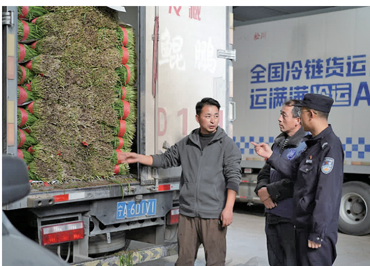
治保委成员联合派出所民警走进当地企业,与企业负责人现场沟通,征集意见建议。