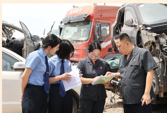
2025年9月，检察官赴甘肃省白银市对法院执行活动进行现场监督。