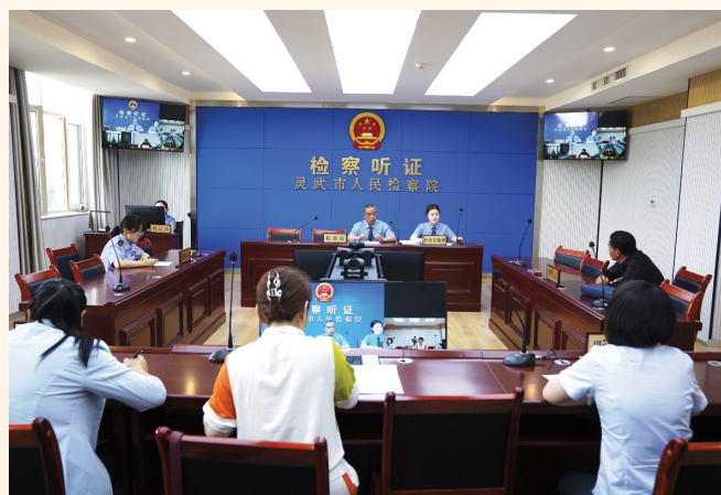
2025年6月，该院召开公开听证会。