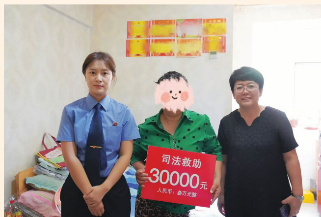
2025年8月，检察官到被救助人家中发放司法救助金。