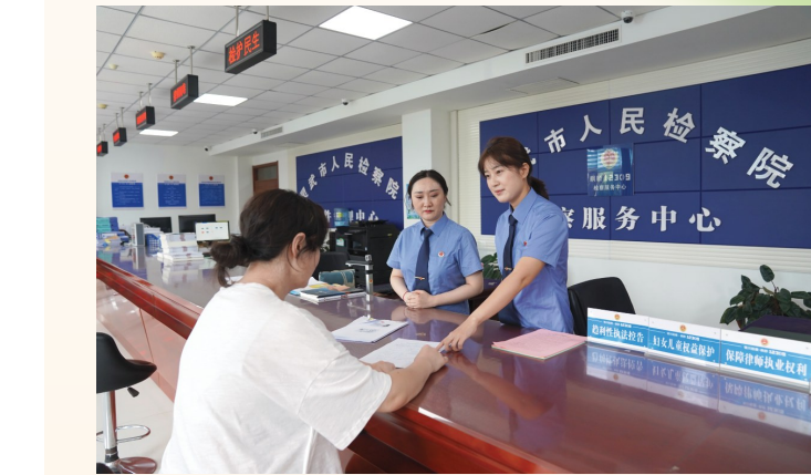
2025年8月，该院12309检察服务中心检察干警为群众讲解法律知识。