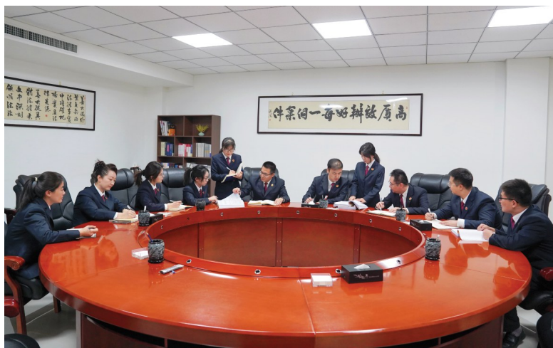
“未解”刑事检察专业化办案团队研讨案件。