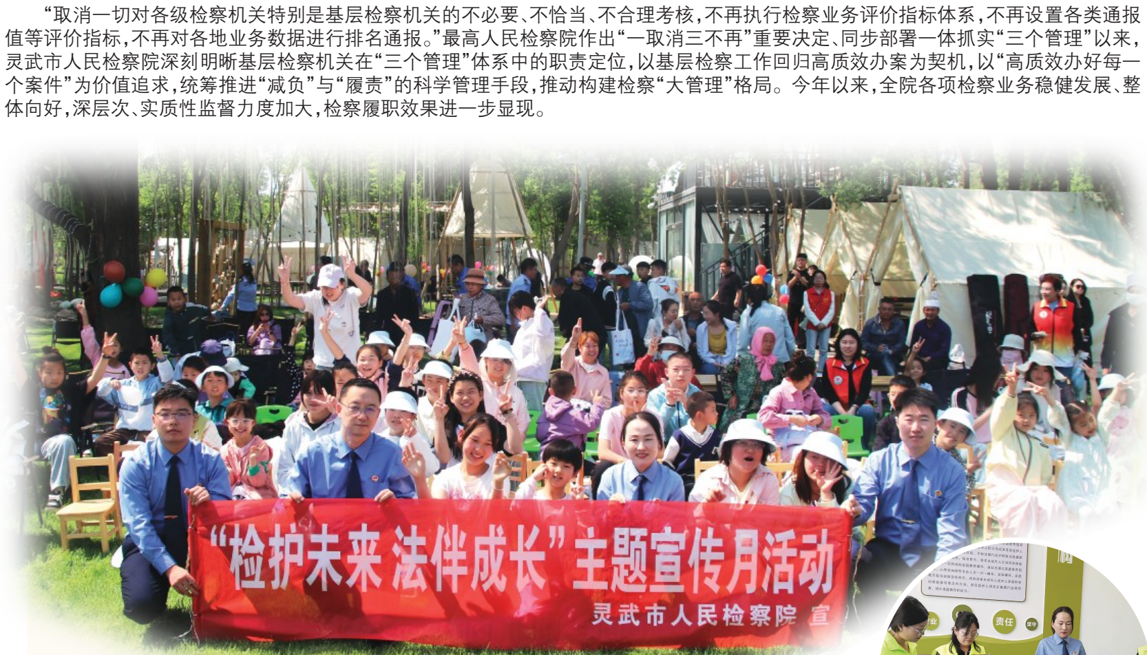
2025年5月第二检察部开展“检护未来 法伴成长”主题宣传月活动。