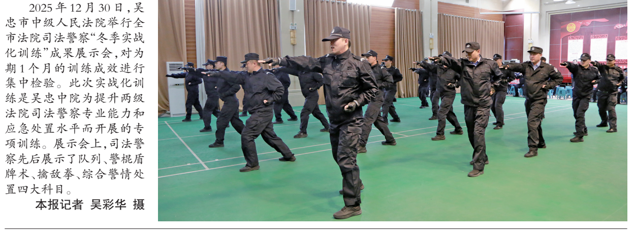
2025年12月30日,吴忠市中级人民法院举行全市法院司法警察“冬季实战化训练”成果展示会,对为期1个月的训练成效进行集中检验。此次实战化训练是吴忠中院为提升两级法院司法警察专业能力和应急处置水平而开展的专项训练。展示会上,司法警察先后展示了队列、警棍盾牌术、擒敌拳、综合警情处置四大科目。

组的不懈努力下,三家人终于坐在一起,心平气和地签订了调解协议,并当场履行了补偿款分配方案。 “感谢党和政府,要不是你们,这钱估计我永远都拿不到手。”分到补偿款的李大娘激动地握住工作人员的手说。 中宁县政法委副书记马元告诉记者:“中宁县两级综治中心围绕‘五个规范化’建设要求,靶向发力、持续用力,不断提升矛盾纠纷吸附率、办结率、满意率,降低反复率,让难事在‘调’中办、难题在‘调’中解。”