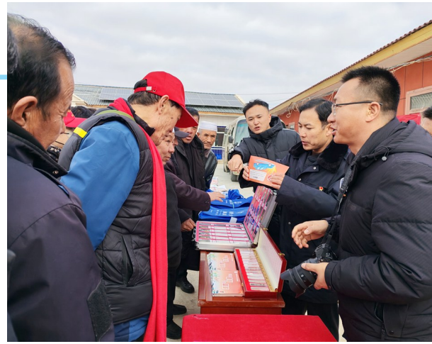
近日,同心县禁毒办在预旺镇贺家窑村“同心筑梦共庆贺岁欢歌迎新年”元旦联欢助农系列活动现场,创新开展禁毒宣传、暖心帮扶于一体的禁毒主题活动。