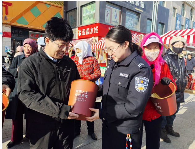
12月30日,彭阳县禁毒办联合县文广局、司法局等部门,在明皇购物广场开展“文化进商圈 禁毒零距离”主题活动,共发放宣传资料300余份,接待群众咨询120人次,覆盖商户80余家。