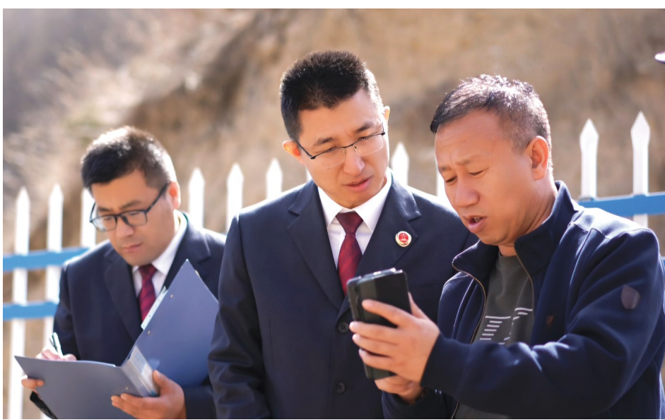
2025年，固原市原州区人民检察院根据“河长+检察长+警长”工作机制，邀请河长、检察长，在清水河源共同开展巡河活动。