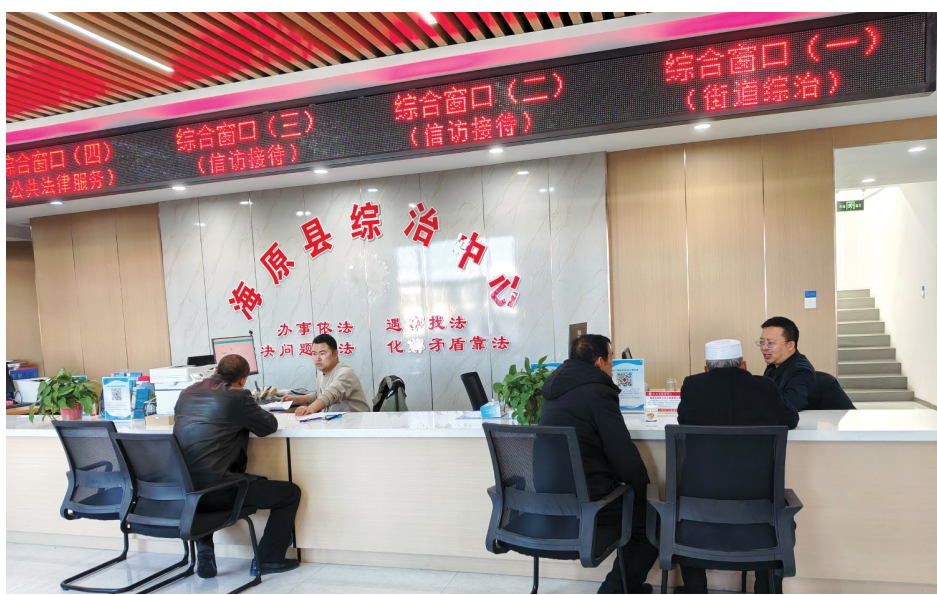
2025年，海原县综治中心为群众提供矛盾化解等服务。

“最多跑一地，服务零距离”，联合编组的实践与成效，是固原市政法力量联动促进矛盾纠纷源头化解的生动缩影。(下转02版)