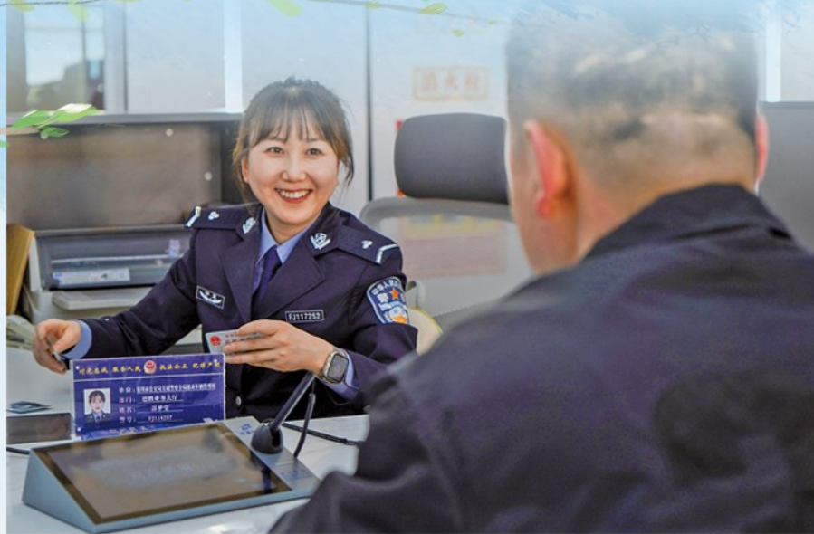
德胜车管所业务大厅，“绿色通道”开启便民服务“快车道”。