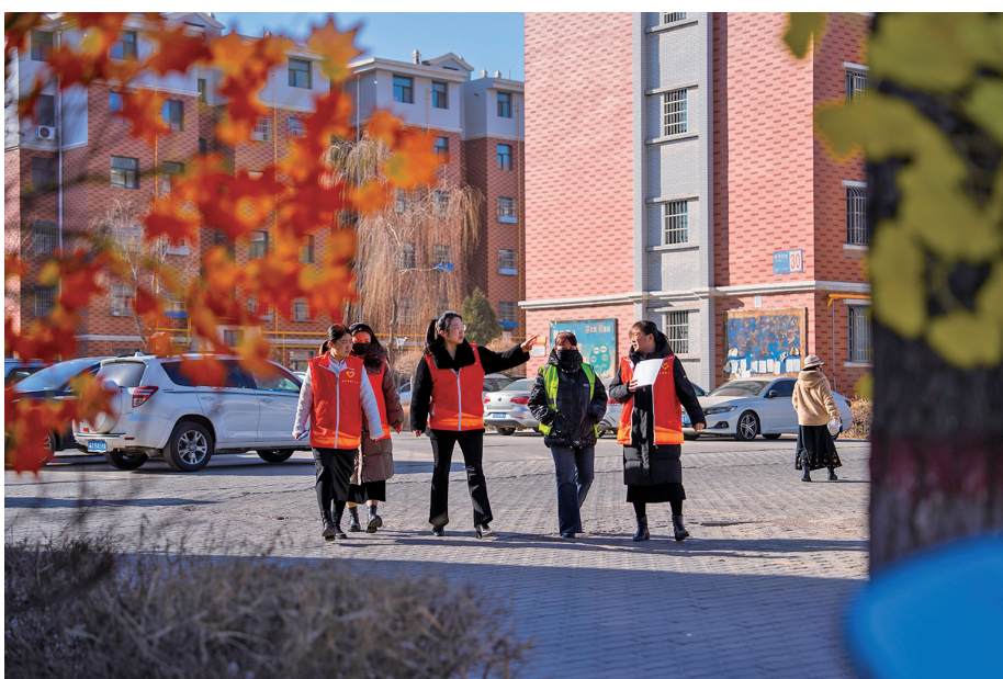
平罗县城关镇明月社区治保委开展日常巡逻。