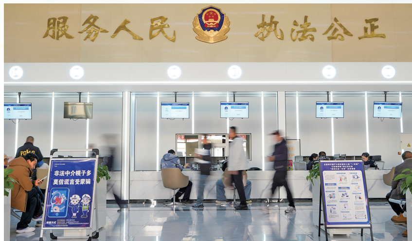
银川市车管所德胜业务大厅内，群众有序办理机动车、驾驶证、违法处理等业务。

“平时我们的快递员要负责所在区域的派件工作，工作时间不固定，无法集中到车管所来办理上牌业务，车管所为我们‘特事特办’解决了难题。”当天，顺丰快递公司石油城网点负责人马经理到车管所办理电动三轮车上牌业务。由于快递员很难凑到一起查验车辆，经过协调，由他先在车管所打好验车单，带回网点分发给快递员，他们根据自己的时间安排，抽空到车管所验车，将验车单交回给