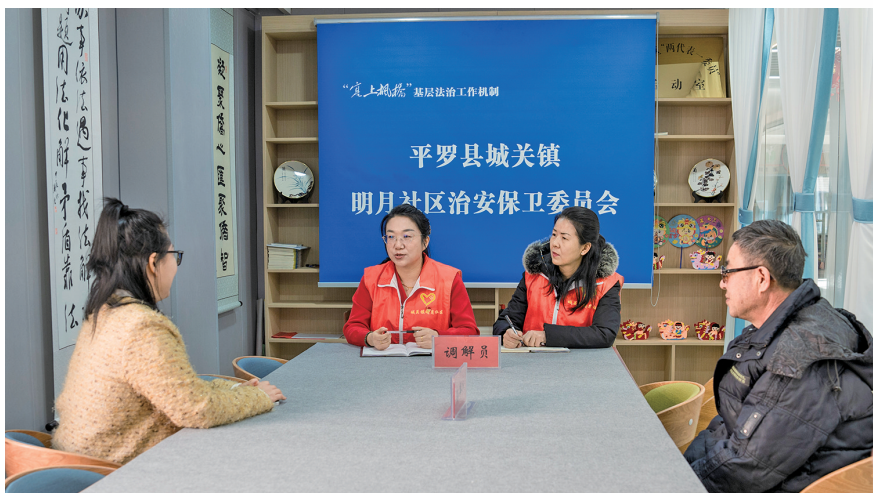
“老舅妈”调解团调解居民家长里短事。