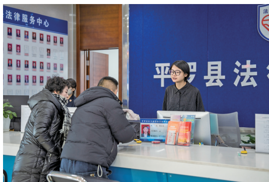
平罗县综治中心法律援助窗口，工作人员正解答群众咨询。