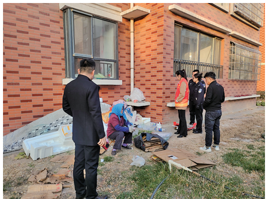
治保委成员对在公共区域堆放废品的居民进行劝导。