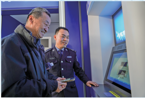
银川车管所工作人员手把手教老年人操作自助服务终端。