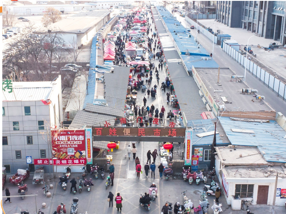
春节将至，银川市小南门早市迎来年货采购客流高峰。

这只是银川市市场监管部门守护年味的一个缩影。随着春节的临近，银川市市场监管部门用“监管蓝”守护“春节红”，让群众买得放心、吃得安心，过一个平安祥和年。