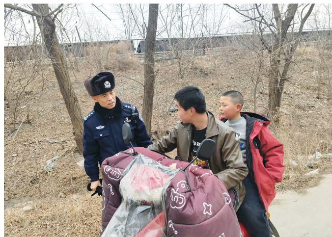
铁路公安民警对铁路沿线群众开展安全宣传。