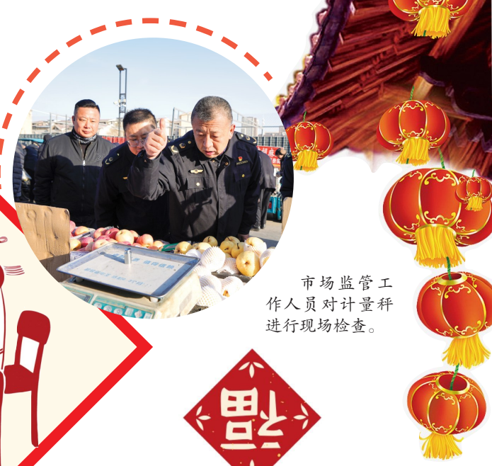
市场监管工作人员对计量秤进行现场检查。

2月10日，腊月二十三，清晨8点多，银川市兴庆区小南门便民市场已是人声鼎沸。摊位上，蔬菜水灵、肉品新鲜、干果满筐，浓浓的年味扑面而来。人群中，几位身着深蓝制服的执法人员格外显眼——他们是银川市市场监督管理局兴庆区分局新华市场监管所的“年节卫士”。