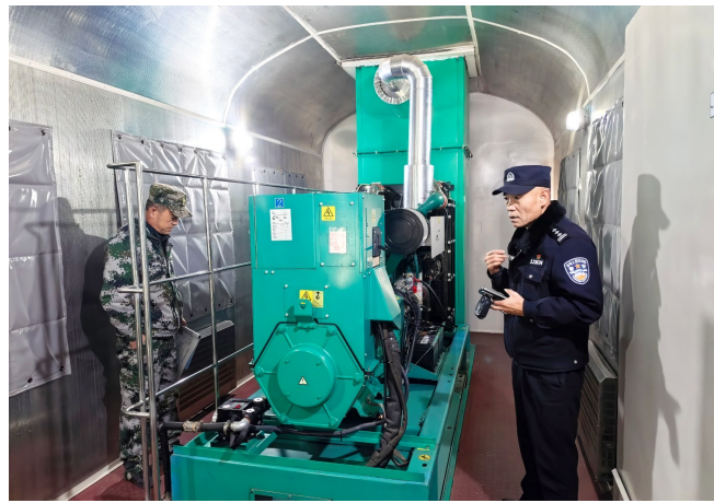
固原站派出所民警对车站内部开展安全检查。