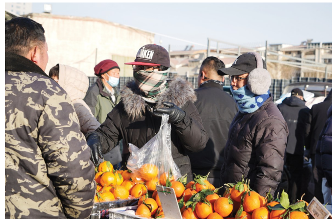
市场内年货采购氛围浓厚，市民争相选购年货。