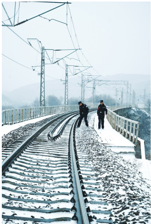
细致检查，确保线路畅通。