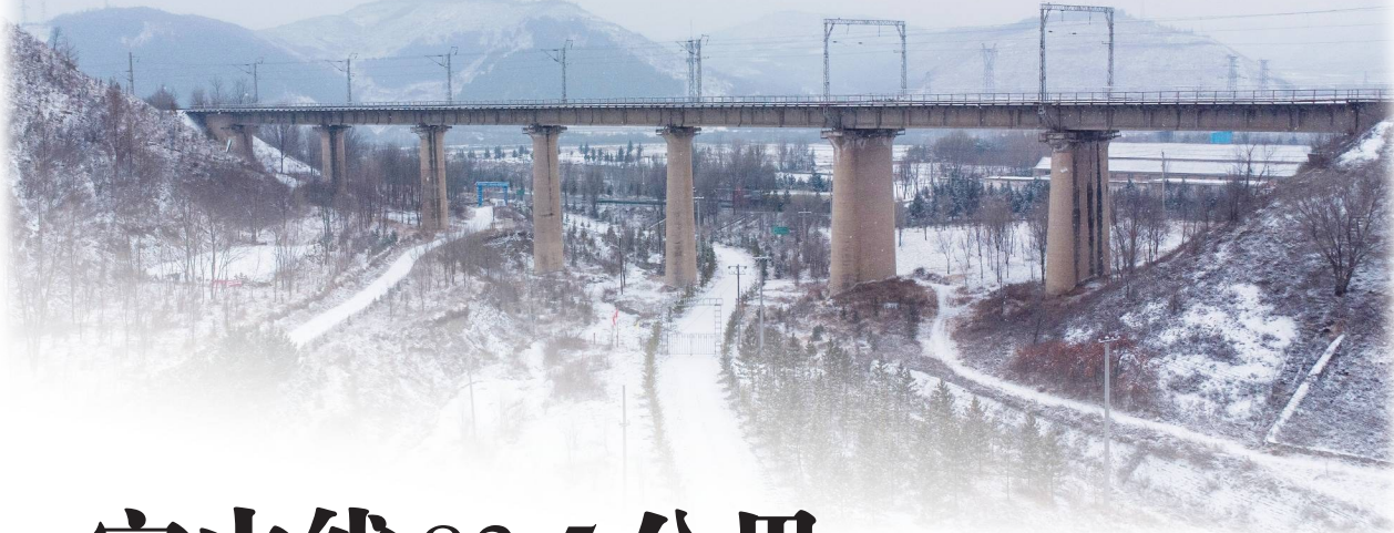
六盘山警务区管辖铁路沿线200公里。