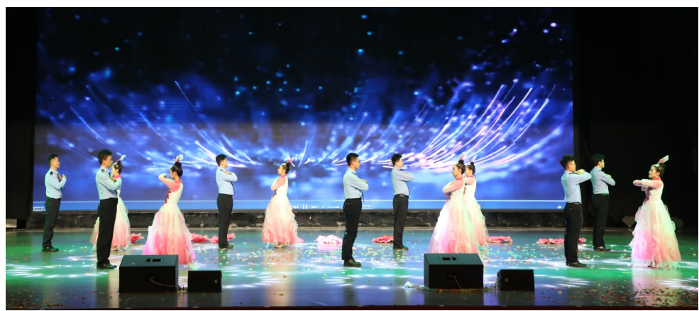
近日,原州区公安分局举办“护航万家灯火 共庆新春华章”2026年警营新春晚会,全体民警辅警与警属欢聚一堂共迎新春,展示队伍风采,凝聚奋进力量。

今年以来,西吉县行政争议化解中心秉持“化解行政争议,维护群众权益,促进社会和谐”宗旨,通过多元联动的工作模式,将矛盾化解在基层、解决在萌芽状态。2025年,该中心共化解行政争议类案件34件、涉府民事类案件104件,有效减轻了群众的诉讼负担,切实维护了群众的合法权益。