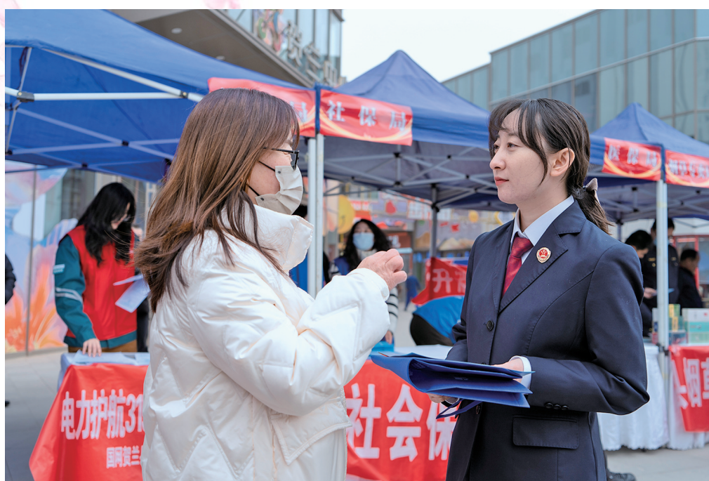
检察人员走上街头开展普法宣传。