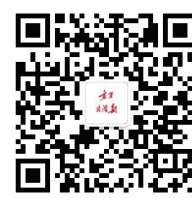
宁夏法治报微信公众号