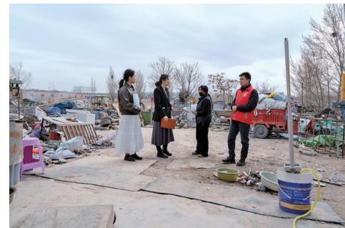
司法所联合社区将摸排工作同步于普法宣传与安全生产宣传。