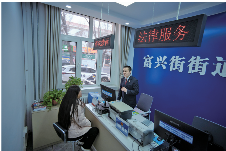
贺兰县检察院在辖区综治中心设立检察服务工作站，为群众提供法律咨询，倾听群众诉求。