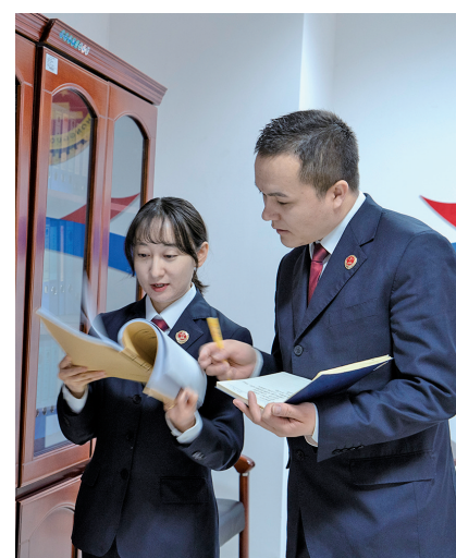
检察干警对线索进行研讨分析。