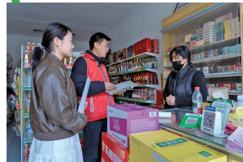
综治专干在辖区走访摸排时，与群众边拉家常边普法。

在洪广镇，群众遇到解不开的“疙瘩”时，“同心圆调解室”就成了大家愿意来说心里话、解烦心事的地方。