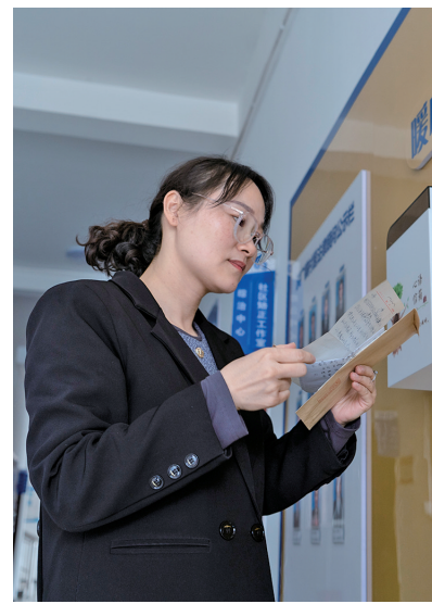
司法所线上线下均设有暖心信箱，畅通民意征集与情况反映渠道。