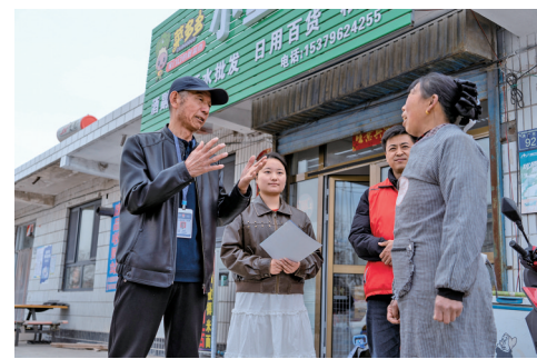
司法所工作人员不定期回访已达成调解的当事人，防范矛盾复发。