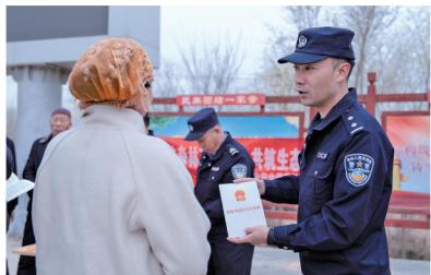
民警向辖区村民宣传生态保护与春季防火知识。