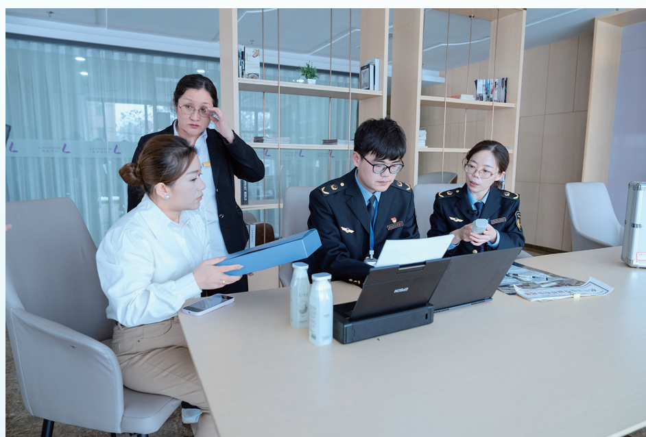
执法人员对辖区一酒店洗护类化妆品开展检查,仔细核实进货来源与相关票据。