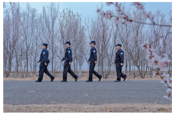
正值山花盛开时节,民警辅警步巡保平安。

据介绍,针对春季进山人员增多的情况,该所民警辅警在进山路口、林缘地带设卡检查,发放防火宣传单,现场宣讲违规用火法律责任与火灾危害。联动护林员用高音喇叭循环播放禁火令,从源头遏制火险隐患。同时紧盯关键节点,联合乡镇干部、护林员推送防火提示至乡村社区微信群,依托“平安利通”公众号发布科普推文,普及防火知识、剖析典型案例,营造“森林防火、人人有责”的浓厚氛围。