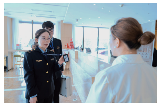
执法人员主动亮明证件、说明来意,严格规范执法流程。