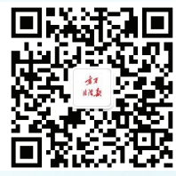
宁夏法治报微信公众号