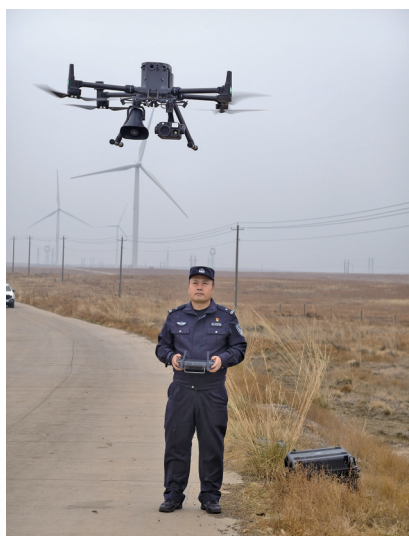
民警借助无人机巡查草原。

春季风干物燥,祭祀用火、农事用火等野外火源管控压力陡增,森林草原防火进入关键期。吴忠市公安局利通区分局森林和草原派出所将春季森林草原防火防控和严打非法采砂等破坏生态行为并行,筑牢自然生态安全防护底线。