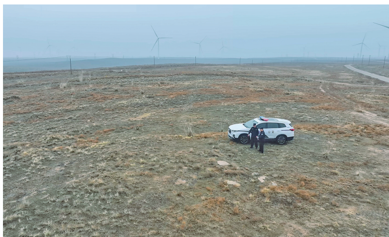
民警利用无人机开展巡邏。