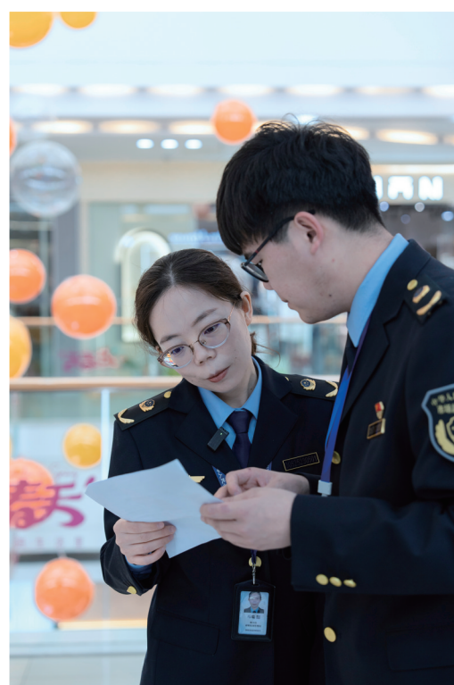
执法人员仔细核对商品信息。