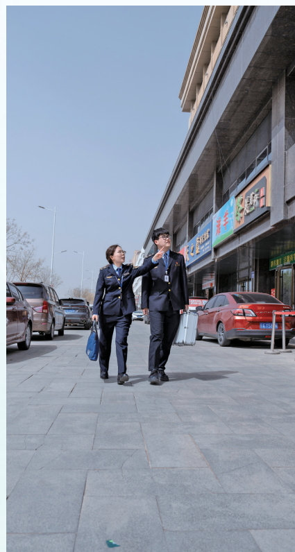
执法人员在辖区随机抽查化妆品销售及使用者。

“您好,我们是银川市市场监督管理局西夏区分局执法人员,今天对您店内的化妆品进行2026年度国家监督抽检,请配合。”4月6日,在银川市西夏区一家商场的美妆专营店内,两名执法人员亮明证件后开始现场检查。