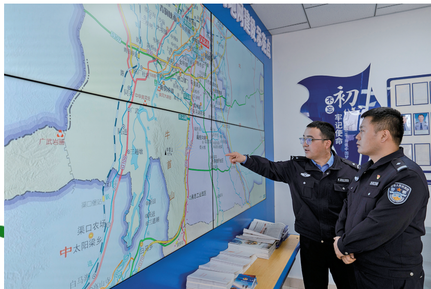
吴忠市公安局利通区分局森林和草原派出所联合辖区派出所开展分析研判。