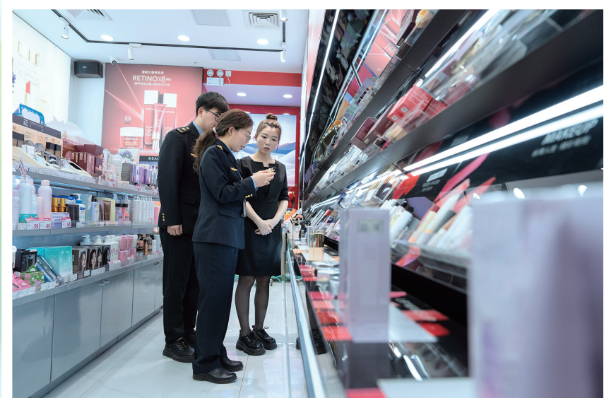
执法人员对辖区商场化妆品销售商家开展随机抽检。