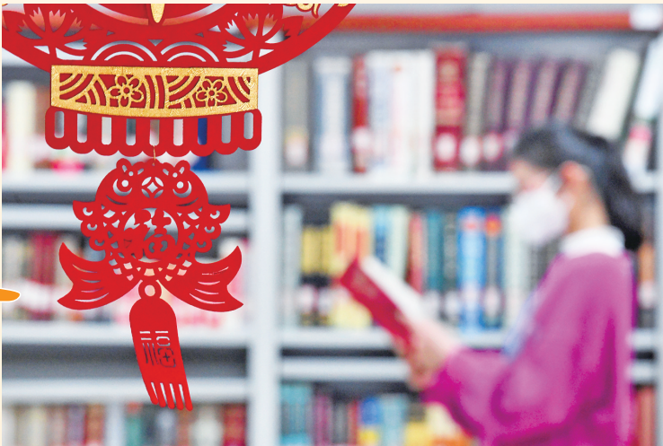
1月31日，银川市西夏区图书馆，火红的灯笼高高挂起，人们在品读中辞旧迎新。