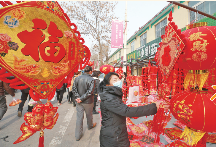
春节前夕，银川市兴庆区乡镇集贸市场，红灯笼、红福字营造出浓郁的节日氛围。