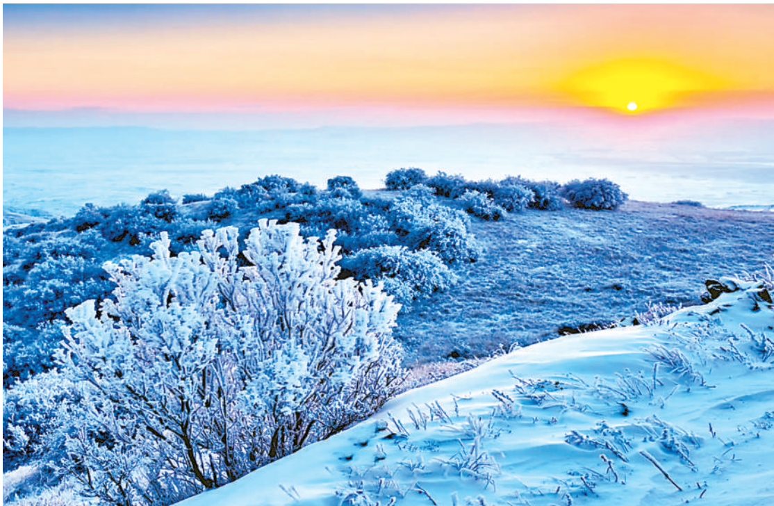
雪后的罗山自然保护区。“林长”当家,实现“山有人管、林有人护、责有人担”。