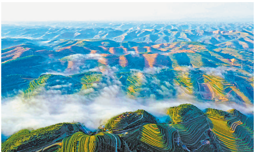
彭阳“云山林海”美景。

“今年,彭阳县以林长制全面实施为契机,将继续开展大规模国土绿化行动,集中连片营造农田防护林、水源涵养林、水土保持林、生态经济林,创新小流域治理模式,持续推进城市绿化美化行动,让彭阳处处见绿、全民享绿。”彭阳县林草部门有关负责人说。