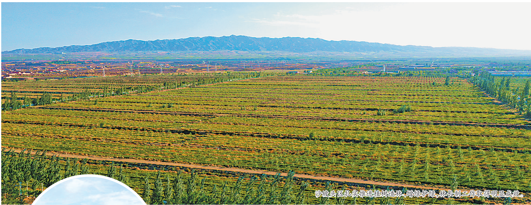
沙坡头区扎实推进植树造林、增绿护绿,林长制工作取得明显成效。