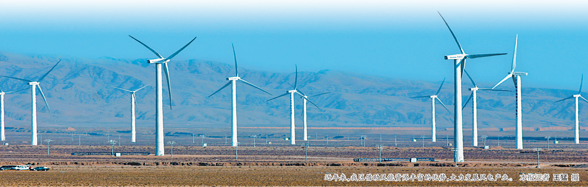
近年来,我区借助风能资源丰富的优势,大力发展风电产业。

约化规模化发展。目前,共注册各类农产品商标48个,培育贺兰红、览翠等4个宁夏著名商标,中粮长城酒庄、晓鸣禽业、犇旺牧业等6家自治区农业产业化龙头企业。种植酿酒葡萄8万亩,建成酒庄13家,年产葡萄酒2.6万吨;种植红树莓2700亩,建成红树莓“旅游+”“生态+”模式田园综合体,成为宁夏最大的红树莓基地;建成福宁、园艺等设施温棚园区7个,各类设施温棚640栋,成为周边地区的“菜篮子”。(下转第五版)