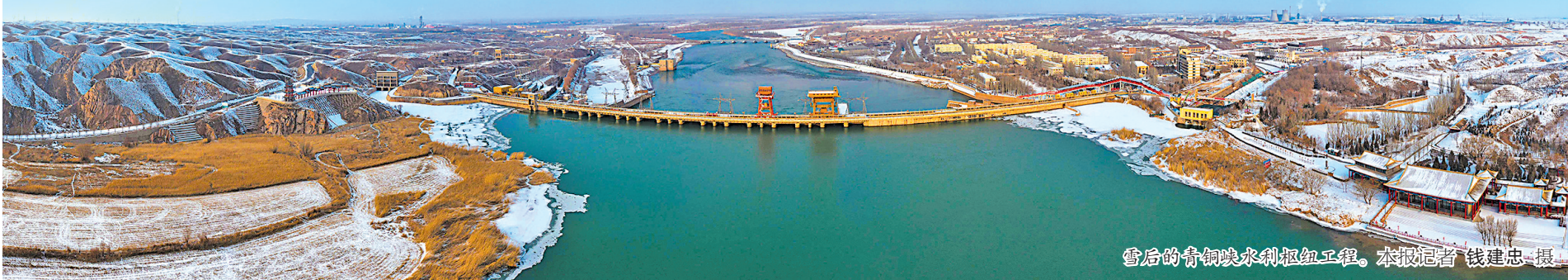
雪后的青铜峡水利枢纽工程。