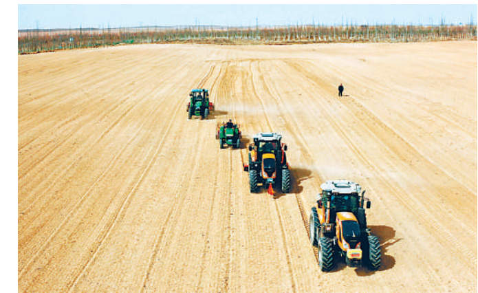
3月12日,吴忠市红寺堡区宁夏富阳工贸集团有限公司红寺堡镇弘德生产基地,工作人员运用北斗导航无人驾驶播种技术种植灌溉节水春小麦。该集团是宁夏万亩高效节水农业示范基地。