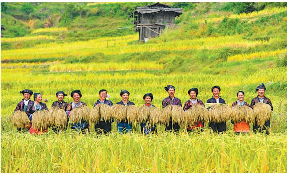
在广西融水苗族自治县寨乡大里村,村民们展示刚刚收割的脱贫特色产品——紫黑香糯(2018年10月12日摄)。