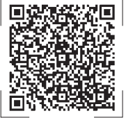
扫码观看新闻视频

自治区领导赵永清、雷东生、杨东,自治区有关部门负责同志在主会场参加会议,各市、县(区)负责同志在分会场参加会议。