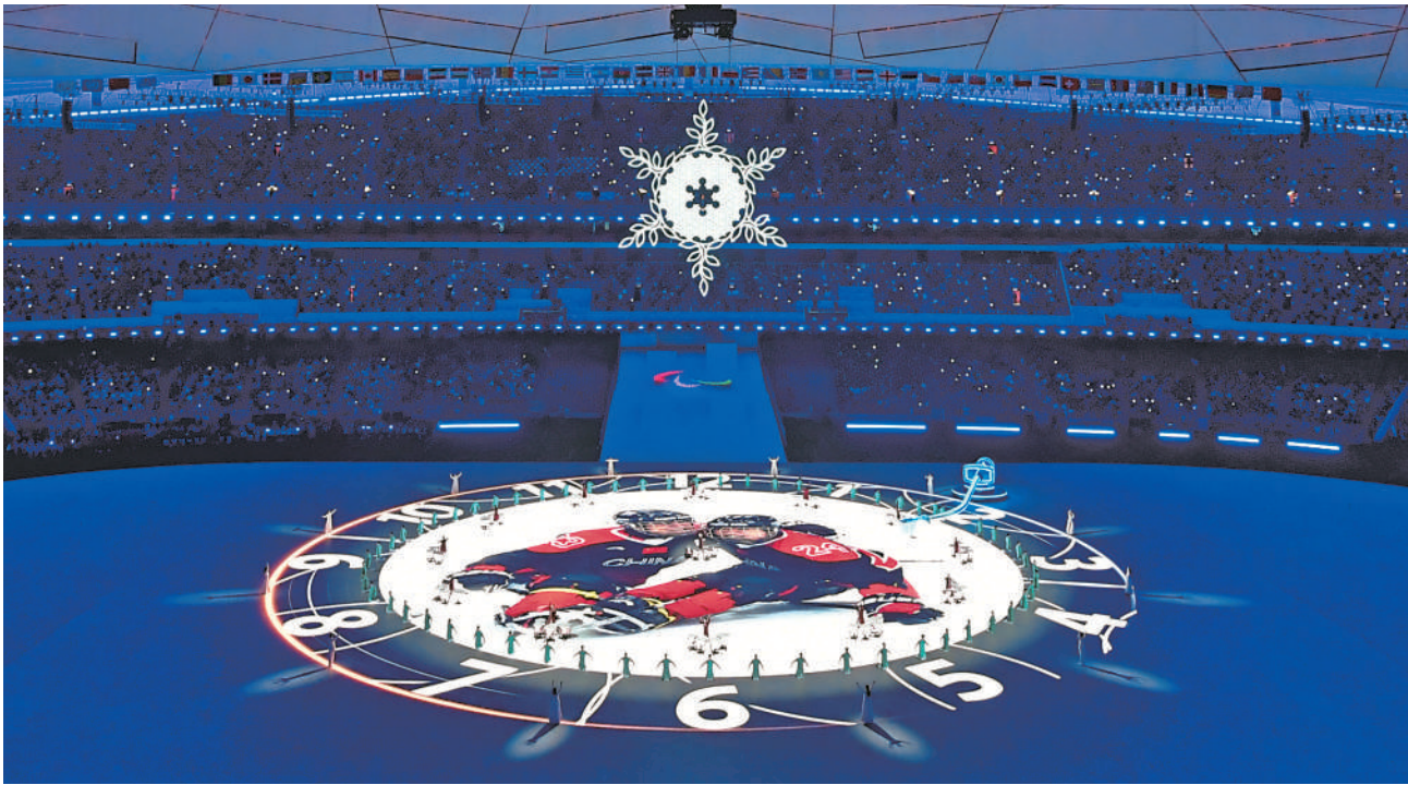
3月13日晚，北京2022年冬残奥会闭幕式在北京国家体育场举行。这是闭幕式现场。

河北张家口也已建成室内滑冰馆20座、冰雪运动培训基地59家，创建冰雪运动特色学校100所。建成大型滑雪场9