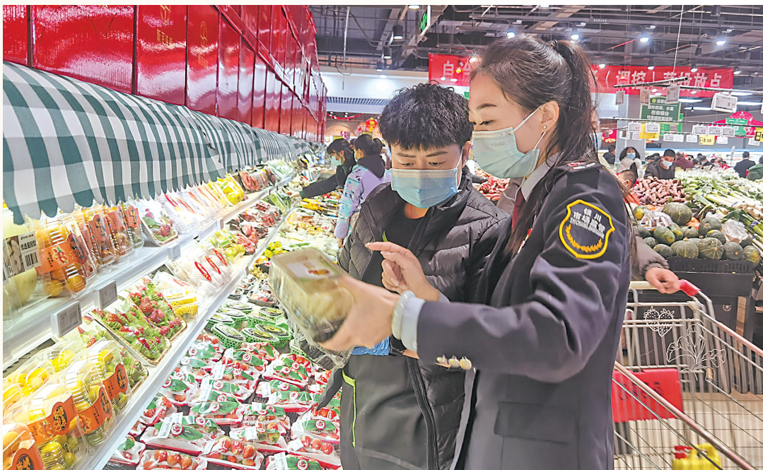
在银川市金凤区物美超市森林公园店,银川市市场监督管理局工作人员仔细查看商品包装上的生产日期、保质期等。