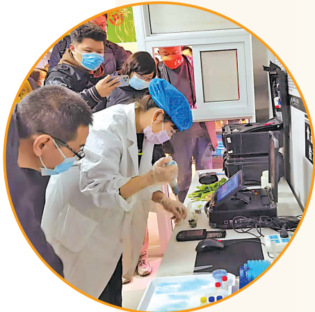
消费体验活动中,消费者代表等“零距离”接触实验室检测食品过程。