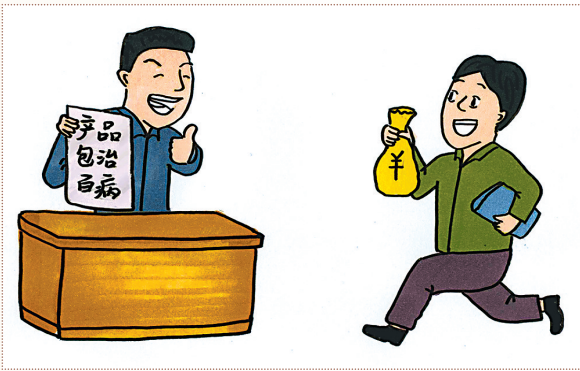
有的经营者为了销售产品,对产品虚假宣传、夸大功能,误导消费者购买。