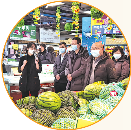
日前,自治区市场监督管理局组织开展消费体验活动,邀请消费者代表等群体走进食品生产企业、超市、餐饮单位,了解全域创建“食品药品安全区”工作。