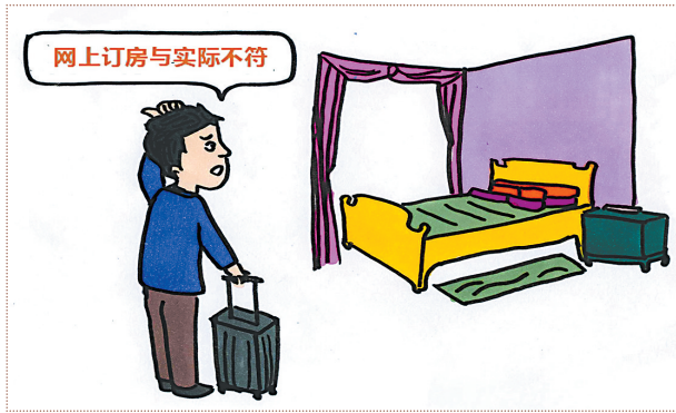
网上订房,经营者宣传的房型图片、文字描述与实际不符,存在差异。