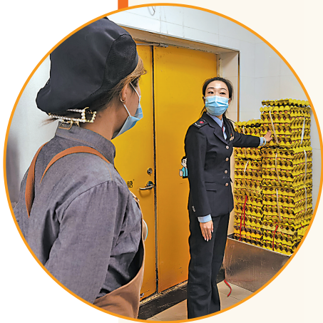
在银川市一家面包糕点经营店,银川市市场监督管理局工作人员查看厨房卫生条件、食品原料存储等情况。