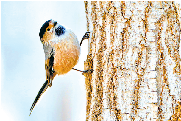
上下跳跃、活泼好动的银喉长尾山雀。

宁夏是候鸟迁徙途经之地。早春三月,大批候鸟回迁,宁夏优质的湖泊湿地资源为候鸟提供了良好的栖息环境。看,候鸟们或是在水中嬉戏、或是在空中翱翔、或是在湿地中打闹,鸟儿优美的身影和悦耳的鸣叫声唤醒了塞上江南的春天。