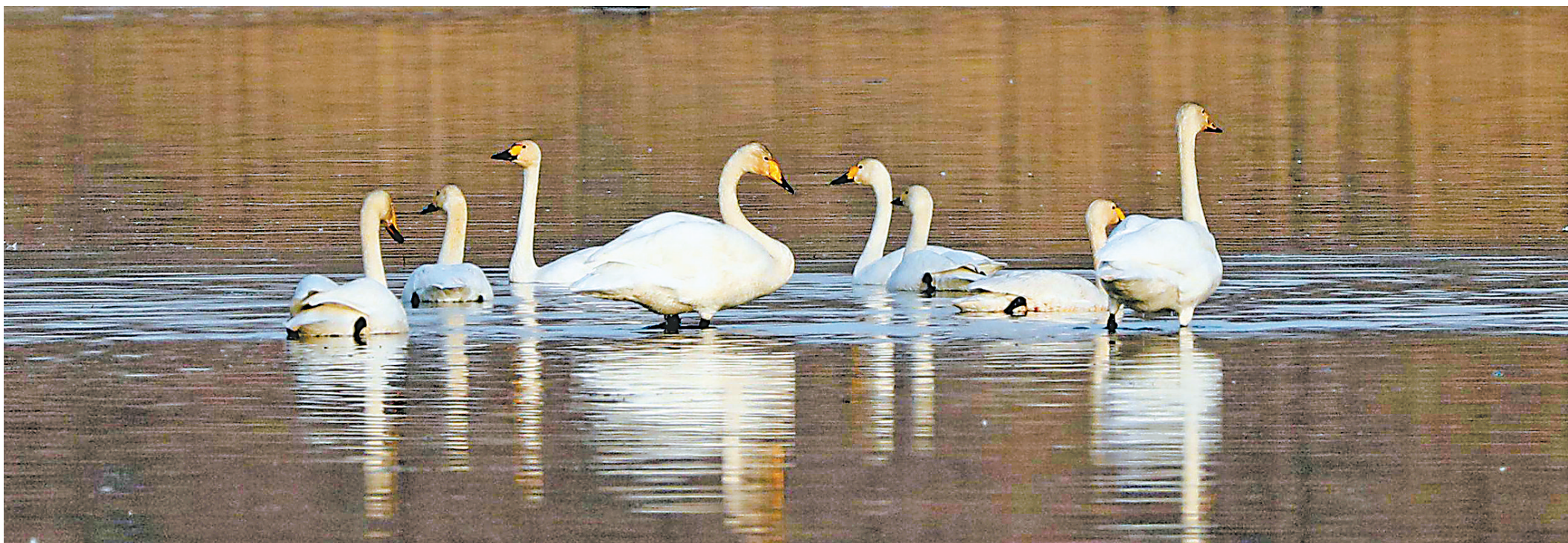
大天鹅嬉戏典农河。