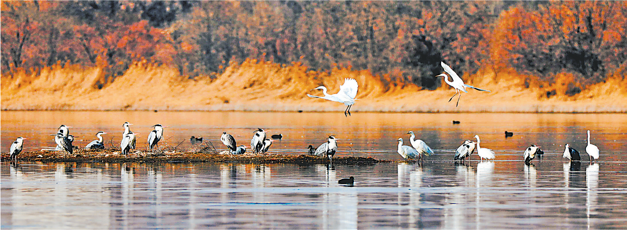
苍鹭与白鹭和谐相处。