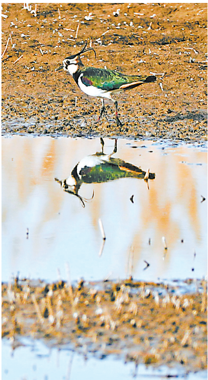
在浅滩觅食的风头麦鸡。