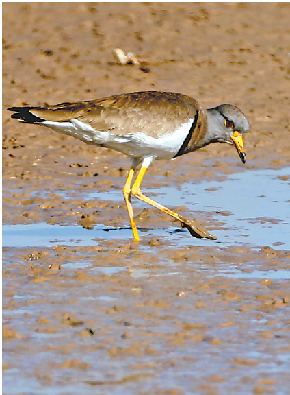
领地意识很强的灰头麦鸡。