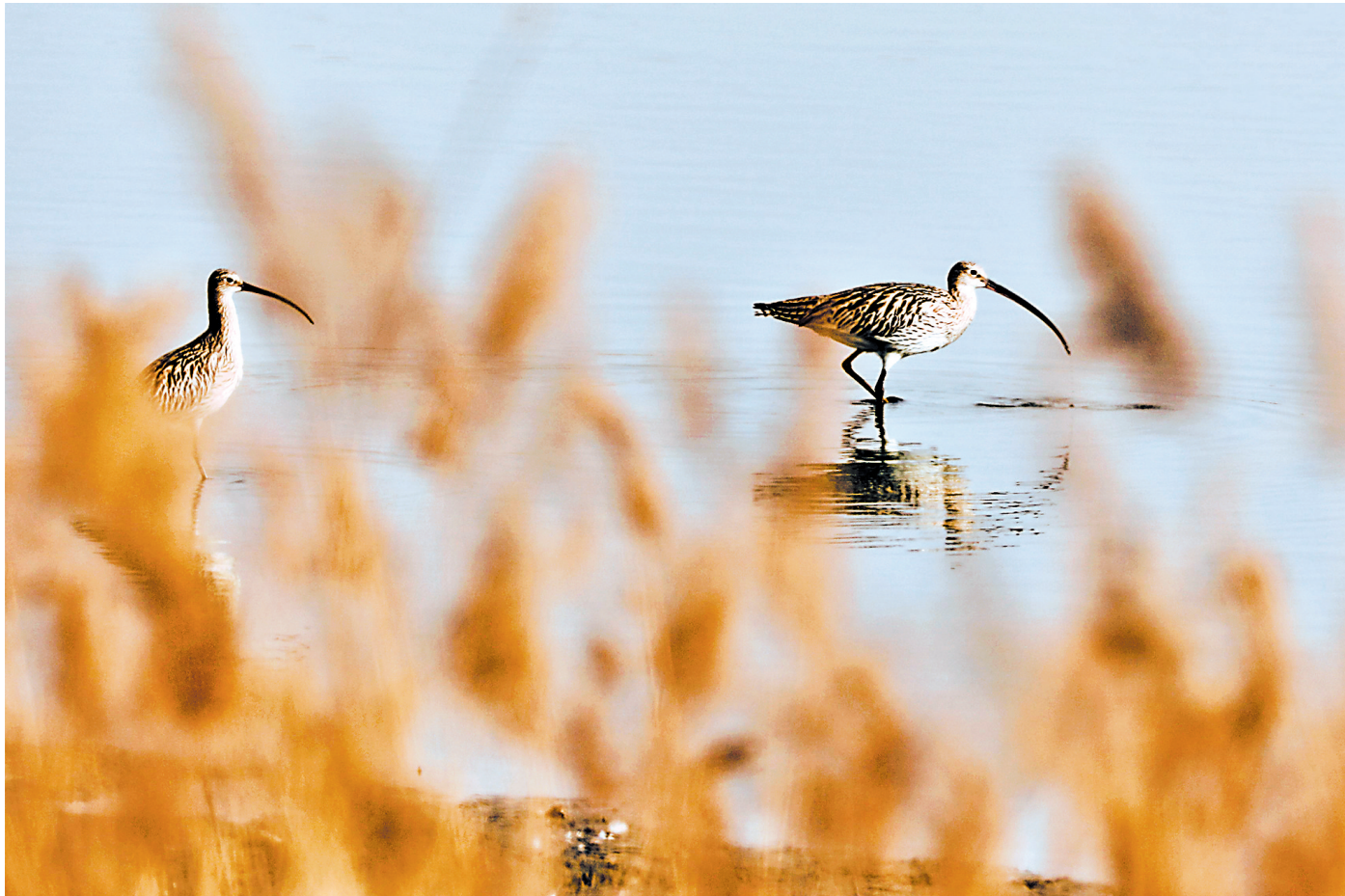
白腰杓鹬在沙湖湿地栖息。