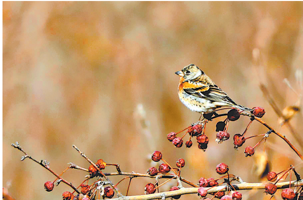
银川凤凰公园,一只燕雀站立枝头。