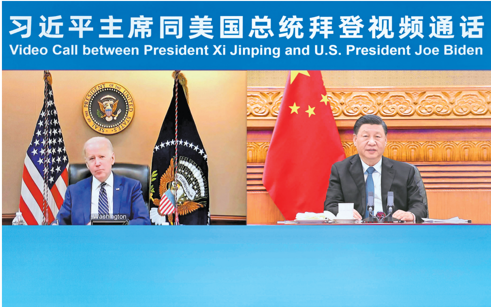
3月18日晚,国家主席习近平在北京应约同美国总统拜登视频通话。

新华社北京3月18日电 国家主席习近平18日晚应约同美国总统拜登视频通话。两国元首就中美关系和乌克兰局势等共同关心的问题坦诚深入交换了意见。