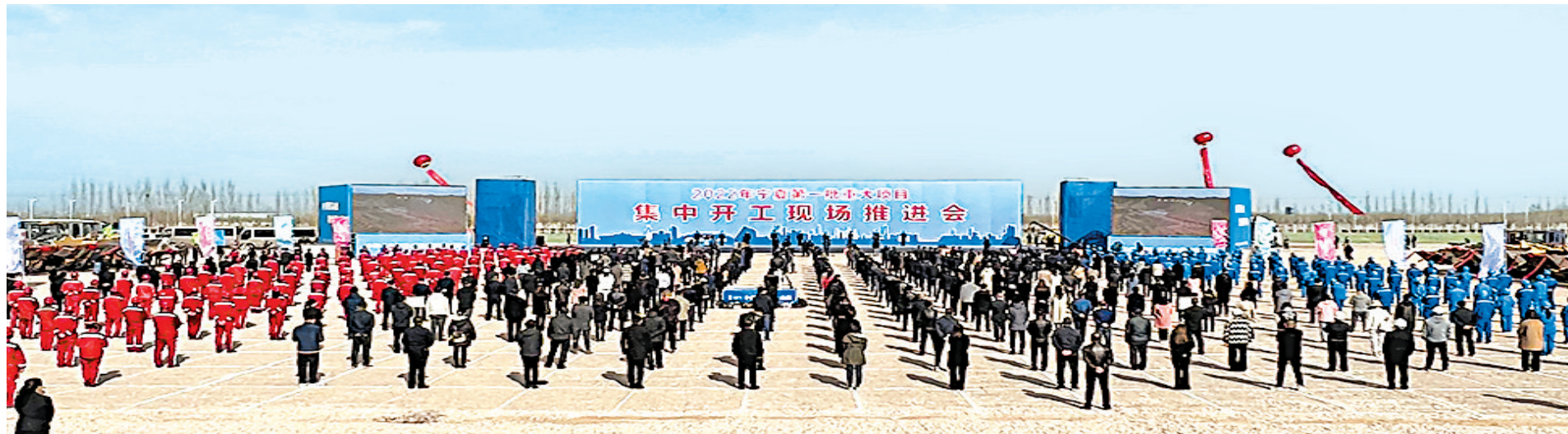
3月18日,2022年全区第一批重大项目集中开工现场推进会在银川苏银产业园宁夏宝丰显能科技有限公司100GWh电池及储能集装系统示范项目建设现场举行,五市及宁东能源化工基地的25个分会场与主会场联动开工。

推进会后,陈润儿实地调研了宝丰集团人造石墨负极材料、磷酸铁锂正极材料、电解液等储能全产业链规划建设情况,鼓励企业要抢抓“双碳”战略机遇,利用宁夏丰富的资源能源优势,积极布局发展新能源、新材料产业,加强与上下游龙头企业合作,打造产业集群,形成产业基地,提高市场竞争力,增强市场话语权。