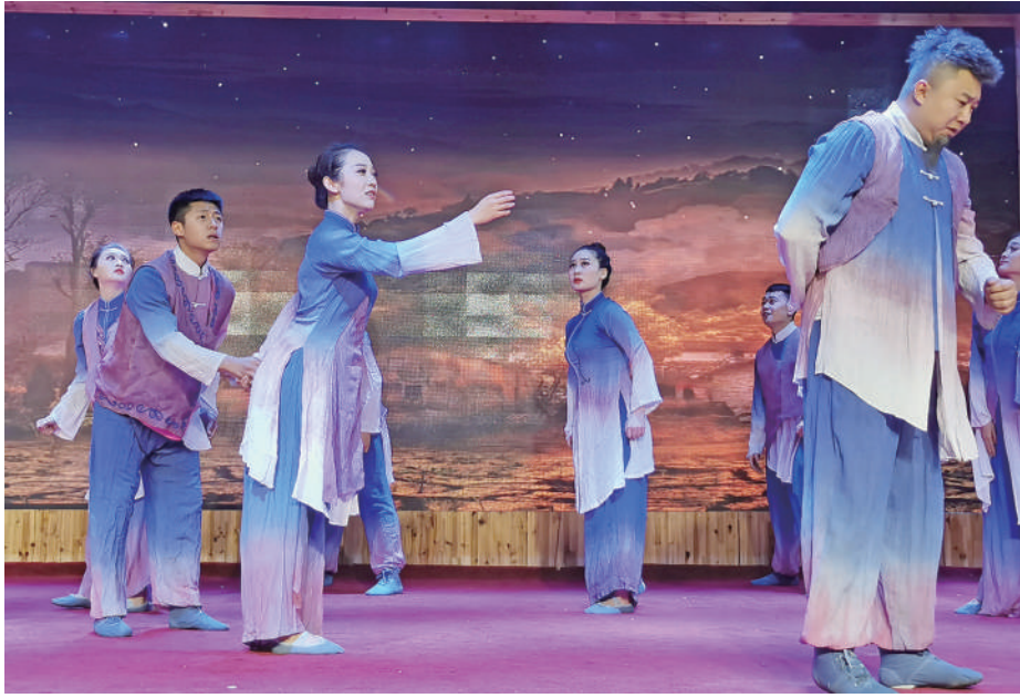
文艺志愿服务者在演出中。

在文艺志愿服务活动中,如何进一步发挥文艺志愿者“传帮带”示范作用?宁夏文联的“圆梦工程”以区内8个贫困县的乡