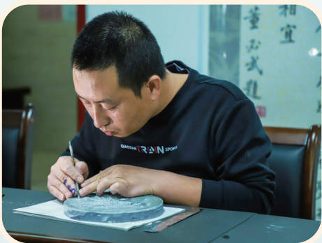
推进非遗与旅游融合发展项目建设。

推动博物馆改革发展。 深化“智慧博物馆”建设,丰富线上数字体验产品和公共文化“沉浸式”“互动式”服务项目。开展博物馆联