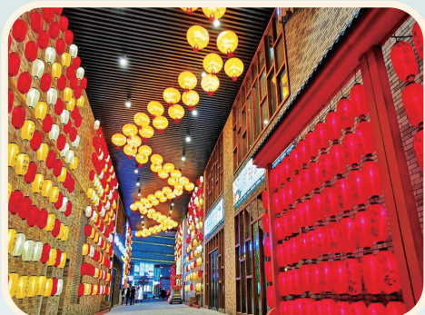
建发大阅城旅游休闲街区。

深化交流合作。 加强对外和对港澳台文化交流和旅游推广工作,讲好中国故事,展示宁夏精彩。举办“丝绸之路”主题旅游海外推广季启动仪式暨非遗传承及旅游发展国际论坛,实施宁夏“丝绸之路”海外推广系列项目。聚焦港澳、东南亚等重点入境旅游市场,以线上弥补线下、云端推动终端,持续推进“云秀宁夏”和区域化营销推广项目。