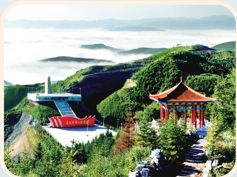
4A级景区——六盘山红军长征景区。

推动黄河流域生态保护和高质量发展先行区建设。 做好黄河文化、黄河景观、黄河生态融合示范,深入挖掘、记录、阐释黄河文化(宁夏段)精神内涵,推出一批有影响力的精品力作、搭建一批有品牌力的文化载体、建设一批有带动力的示范项目。依托黄河流域(宁夏段)历史人文资源、自然景观资源,有机融入葡萄酒、枸杞等特色产业,打造多样化、多层次生态观光游、休闲康养游、科普研学游,推进宁夏黄河文化旅游带建设。