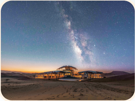
沙坡头旅游区星星酒店。

建设数字文旅。 完善宁夏旅游资讯网等三位一体平台功能,推动全区文化旅游资源和公共服务等信息,一张图展示、一平台共享、一端口应用。实施“星星故乡·数字文旅”项目,