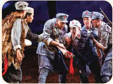
音乐剧《花儿与号手》。

打造文化育人品牌。 推动宁夏“文化大篷车”,打造全国时代楷模,以“文化大篷车”特色