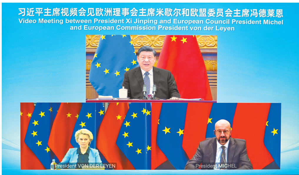
4月1日晚,国家主席习近平在北京以视频方式会见欧洲理事会主席米歇尔和欧盟委员会主席冯德莱恩。

新华社北京4月1日电 国家主席习近平4月1日晚在北京以视频方式会见欧洲理事会主席米歇尔和欧盟委员会主席冯德莱恩。习近平指出,8年前,我提出中国愿同欧洲一道打造中欧和平、增长、改革、文明四大伙伴关系,中方的这一愿景至今未改变,当前形势下更有现实意义。中欧有着广泛共同利