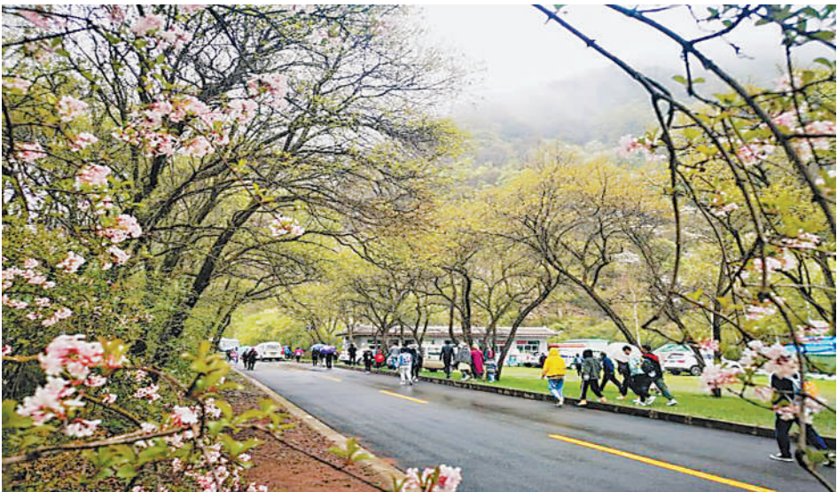
游客前往六盘山国家森林公园游玩。

睐。在贺兰县金贵牡丹花乡,游客体验户外烧烤、插花及手工制作,与萌宠互动;在石嘴山市大武口区龙泉村,拥有田园等特色农庄,游客尽情游园、采摘;在吴忠市利通区牛家坊村、青铜峡市韦桥村,游客享受田园风光,体验吴忠美食;在中卫市沙坡头区北长滩村等特色乡村,游客赏山花、摄影采风,体验特色民俗。良好的生态、古朴的风貌、特色的美食,使游客在这里望得见山、看得见水、记得住乡愁。 为强化疫情防控,保障节假日出游安全,自治区文化和旅游厅坚持“查一带一片、督一地警四方”原则,建立隐患整改闭环管理机制,切实筑牢假日疫情防线。持续推进“宁夏旅游目的地小程序”应用,并充分利用各类媒体和平台,多渠道发布疫情防控、预约购票、文明出行等温馨提示。各景区严格执行“限量、预约、错峰”入园政策,实行健康码、行程码联查,打造安全、健康、文明的文化和旅游环境。