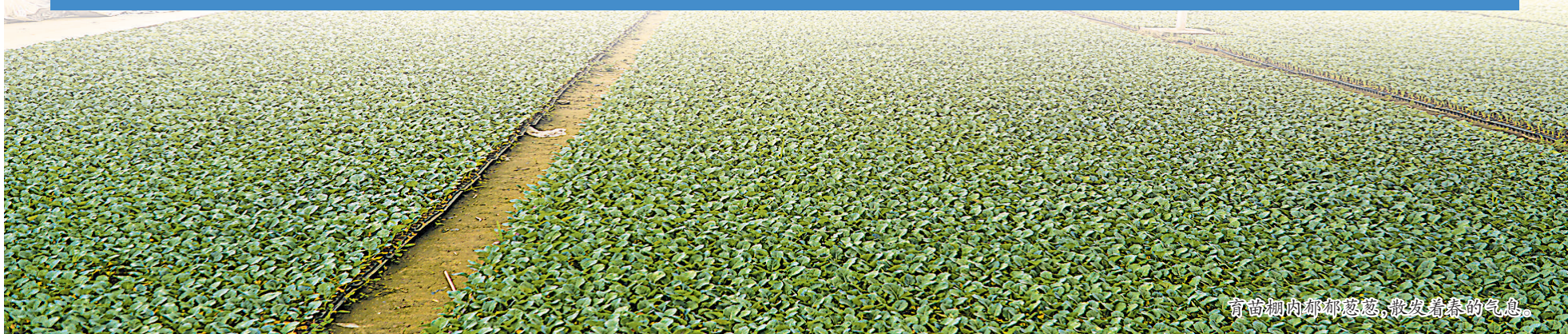
育苗棚内郁郁葱葱,散发着春的气息。