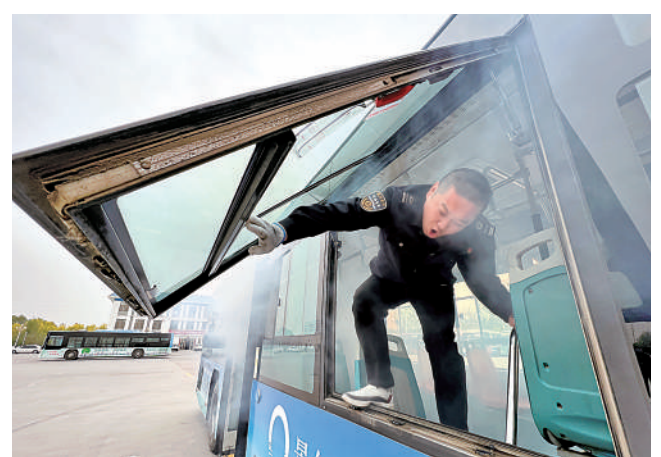
4月27日,永宁县消防救援大队对辖区内银川公交永宁有限公司部分驾驶员进行安全培训,并开展应急演练。演习中,车厢内浓烟弥漫,驾驶员在指挥“乘客”安全撤离后,迅速推开应急逃生窗跳车逃生。

寒流拦不住暖春的步伐,疫情挡不住奋进的车轮。近日,我们收到了一条振奋人心的好消息:在疫情等一系列不利因素的干扰下,我区一季度依然取得了“总体平稳、稳中有进、开局良好”的靓丽答卷,实现地区生产总值1114.13亿元,同比增长5.2%。 来之不易的成绩让人备受鼓舞,催人奋进,但同时也提醒我们,一山放过一山拦,面对企业经营困难加大、消费恢复态势缓慢、保供稳价压力较大等突出问题,二季度我区发展之路注定荆棘密布、崎岖坎坷。矛盾交织下、困难叠加中,如何勇敢突围、破浪前行?一季度塞上山川的火热实践启示我们,唯有一如既往地握紧发展这把“总钥匙”,拿出抗疫的劲头奋战二季度,加足马力,大抓发展,抓大发展、抓高质量发展,才能确保双过半、夺取全年胜,以优异的成绩献礼党的二十大和自治区第十三次党代会。 爱拼才会赢。无数实践告诉我们,干事业谋发展没有决心和拼劲,各种难题就难以破解,发展就是纸上谈兵;敢于直面挑战、能够迎难而上、善于抢抓机遇,发展步伐才会铿锵有力。前行道路上,只要有“功成不必在我”的境界和“不破楼兰终不还”的决心,始终处在战斗状态,时时刻刻保持昂扬向上的斗志,争先锋、当猛将,做勇士,关键时刻拉得出、冲得上、打得赢,把干劲、冲劲、闯劲体现在对标对表高质量发展的觉悟中,体现在集中精力抓大项目、好项目、新项目的实践中,体现在扩大有效投资、推进创新驱动、保市场主体的实绩中,体现在为群众解决热点难点问题的服务上,体现在一丝不苟的防疫中,把发展主动权牢牢抓在手里,坚定发展信心不动摇,咬定发展目标不放松,戮力同心、砥砺前行,宁夏二季度答卷一定精彩,宁夏的未来必将更加美好!