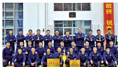
盐池县消防救援大队

他们拥有25项“国家级重点新产品”和400余项国家专利,先后多次取得国家和自治区科技进步奖。承担国家863科研计划“高参数智能控制阀的研究与开发”、国家重点研发计划“高性能特种控制阀国家技术研究与应用示范”等重大项目,顺利完成“海洋油气工程水下控制阀研发”“超大型径调压装置用阀研制”等多项科研攻关任务。团队共有124人,其中35岁以下青年占比73%。