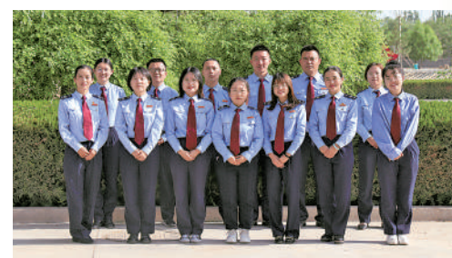
国家税务总局中卫市海兴开发区税务局

他们是一支以90后为主体的青年集体,团队头人是全国文化和旅游系统劳动模范。他们从农业生产、旅游服务、人才培养等方面带动120人就业,208户村民致富。出色地完成了基于坝田养殖的设施绿色葡萄种植技术集成研究与示范、羊肚菌栽培技术研究等科研项目15项,申请专利14个。由团队参与的2020年第三届宁夏农村创业大赛暨第十届青年创新创业大赛获得优秀奖。集体共有18人,其中35岁以下青年占比67%。