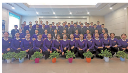
西部机场集团宁夏机场有限公司地面服务分公司旅客服务室

他们是全区唯一一家集康复医疗、教学科研、残疾预防、社会服务于一体的综合性康复机构。近年来,中心积极打造“爱心助残、康复筑梦”青年服务品牌,扎实开展医疗康复、教育康复、工程康复、职业康复等工作;成立青年志愿服务队,踊跃投身环境治理、疫情防控、医疗保障等服务,总时长达27600余小时。集体共有287人,其中35岁以下青年占比62%。