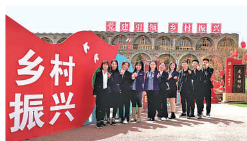
西吉县吉强镇龙王坝乡村振兴青年突击队

近年来,他们累计接警2400余起,救助被困人员370余人,抢救财产价值4亿余元,成功处置4·3官滩草原火灾、4·27天宝化工火灾、3·12恒汇普丰溶碱罐闪爆事故等。组建盐池县“火焰蓝”志愿服务队,开展为民服务50余次。先后2人受到国家级表彰,165人荣获个人三等功、嘉奖及县级以上奖励,被自治区消防总队表彰为先进基层大队。集体共有91人,其中35岁以下青年占比74%。