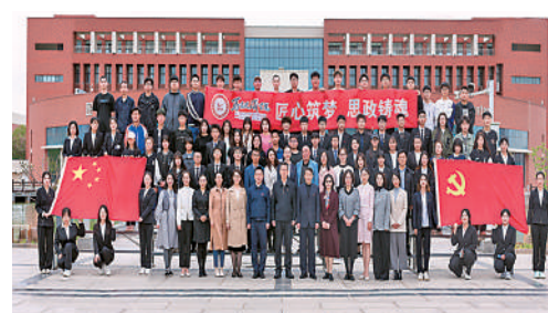
宁夏职业技术学院马克思主义学院

他们是一支奋战在银川河东机场最前沿的青年队伍,承担着进出港航班接送机、机场问询、特殊旅客服务等任务。相继推出了“爱心红丝带”“需要帮助请找我”等一系列“青字号”服务品牌,让旅客充分享受航空服务带来的便捷与热情。疫情面前,他们勇于担当,冲锋在机场防控第一线,累计安全保障高风险地区航班10000余架次。团队共有87人,其中35岁以下青年占比95%。