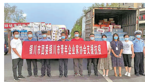
银川市青年企业家协会

他们是全国高职院校思政建设联盟理事和副秘书长单位,近年来紧紧围绕立德树人根本任务,在守正创新中不断提升思政课质效。他们强力推动“互联网+”思政教学,建立课程思政与思政课程同向同行机制;将党课送到田间地头,学生社团、街道社区,努力把思政课程融入社会教育,涌现了一批志愿服务的典型案例和先进个人,屡获嘉奖。集体共有128人,其中35岁以下青年占比84%。