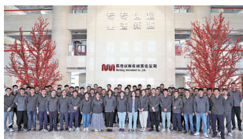
吴忠仪表有限责任公司技术中心

他们是一群科研路上的“追梦人”,始终奋战在钽铌稀有金属材料科研生产最前线,先后承担国家“超纯钽关键制备技术研究”等多项超导体材料重大课题与专项研究,多项成果填补了国内空白,达到国际先进水平,获得中国科学院、北京大学等多个实验室认可。集体共有18人,其中35岁以下青年占比61%。