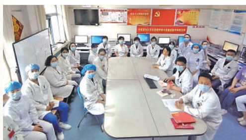
宁夏医科大学总医院呼吸与危重症医学科

女,回族,1986年7月出生,群众,大学本科学历,现任宁夏漫花儿文化艺术有限公司负责人。她致力于推动非物质文化遗产传承、传播与发展,开设花儿公益课堂,普及花儿知识,开展花儿进校园、进社区、进机关等公益活动300余场,受益上万人。为宁夏非遗传承传播作出积极贡献。