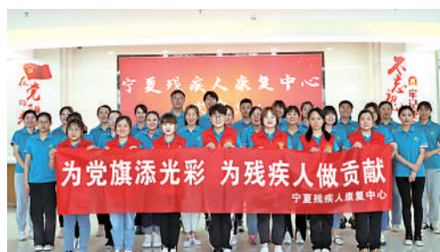
宁夏残疾人康复中心

他们是我区集医疗、科研和教学为一体的呼吸系统疾病诊治中心、自治区重点学科单位。科室先后被授予“全国青年文明号”“全国工人先锋号”等荣誉。在疫情防控工作中先后有13人驰援湖北武汉抗击疫情,32人担负银川市核酸采集任务,彰显了当代青年的责任与担当。集体共有120人,其中35岁以下青年占比64%。