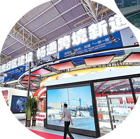
第五届中阿博览会跨境电商展于2021年8月19日至22日在银川国际会展中心C馆举办,跨境电商为企业打造国际品牌提供了新的机遇。