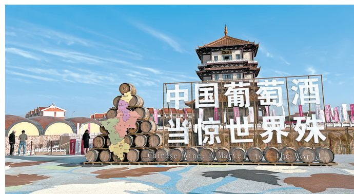
中国首家葡萄酒综合试验区在永宁县闽宁镇挂牌。

2020年6月,习近平总书记来宁视察时强调,要抓住共建“一带一路”重大机遇,坚持对内开放和对外开放相结合,培育开放型经济主体,营造开放型经济环境,以更高水平开放促进更高质量发展。 自治区第十二次党代会以来,作为不沿海、不靠边的内陆省份,宁夏主动融入和服务共建“一带一路”,全力打造丝绸之路经济带战略支点,不断扩大提升对外开放发展水平,激发内陆开放型经济高质量发展实现新突破,新一轮高水平对外开放跑出“加速度”,正书写着融入共建“一带一路”的宁夏篇章。