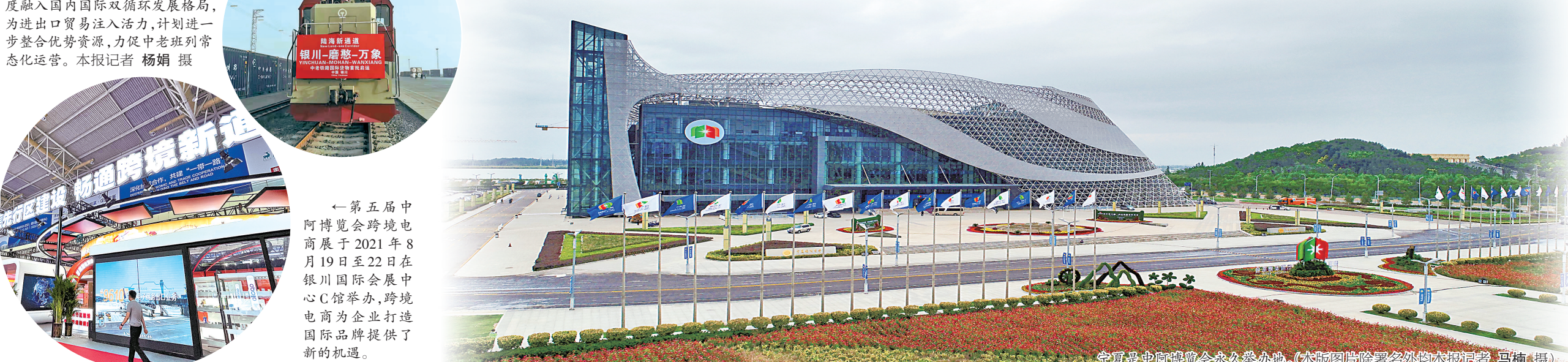
宁夏是中阿博览会永久举办地。