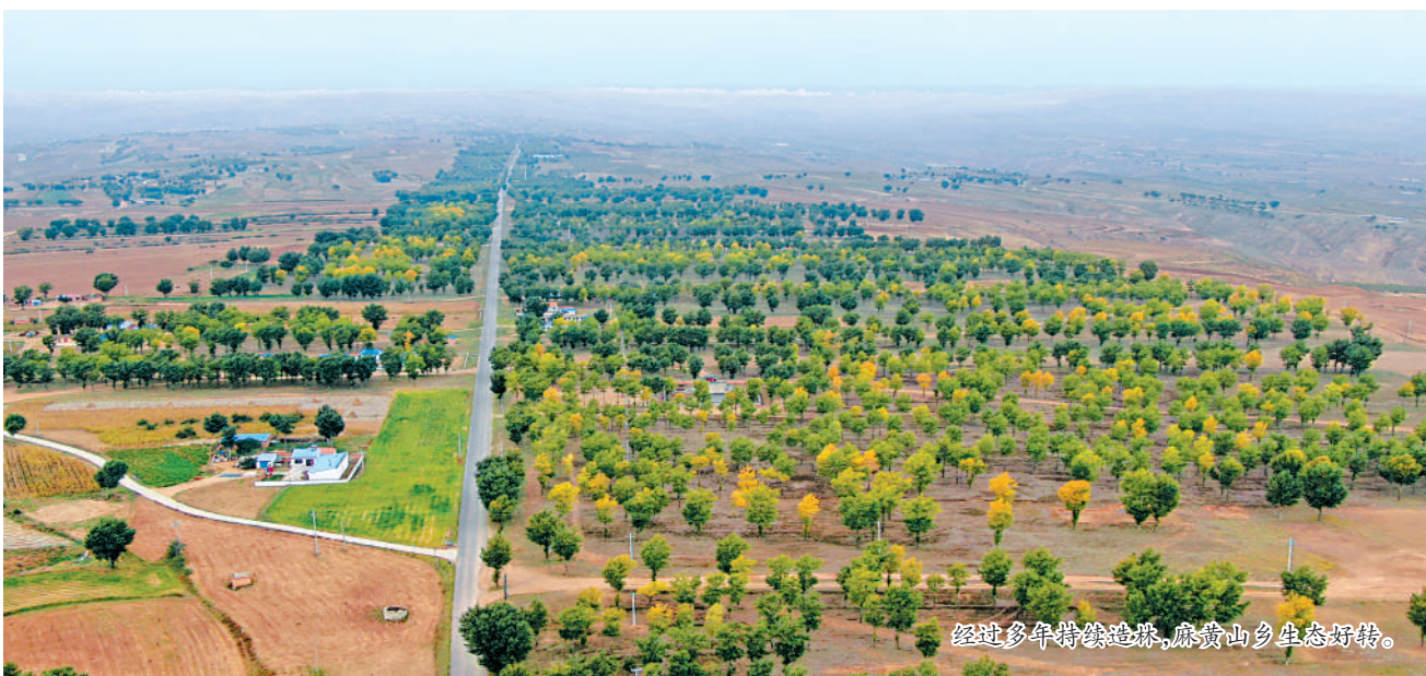
经过多年持续造林,麻黄山乡生态好转。

下“淘金”,在土地上“掘金”,将退耕还林与产业发展、乡村振兴相结合,在25度以上非基本农田坡耕地上统一退耕种植核桃、柠条等作物,耕地得到了有效利用,荒山渐渐绿了起来,也让老百姓享受