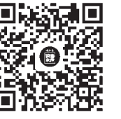
扫码进入宁夏日报读者来信微信公众号