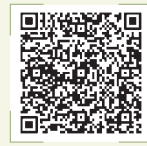
扫码观看新闻视频

内敛、温润、不事张扬——中国传统节日的纪念方式与民族性格一脉相承,对于喜爱新鲜事物的年轻人来说,略显“无味”“无趣”,以至于不少年轻人热衷于快餐一般的“洋节”。承载着中国深厚文化的传统节日应该如何叩开年轻一代的心门?传统节日日怎么过才更有韵味?