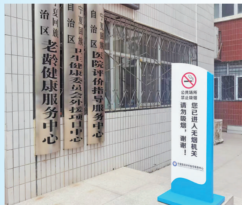
无烟机关门口设立的“禁止吸烟”指示牌。

“戒烟是一个涉及生理和心理的科学问题,向专业人士或医生求助才是戒烟者最好的选择。”张建银介绍,戒烟要有个循序渐进的过程,并需要根据个人戒烟进度调整方案,整体戒烟周期一般为4周至12周。随访在戒烟过程中也起着至关重要的作用,一般戒烟门诊会于患者开始确定戒烟日之后进行跟踪随访,以强化戒烟效果。