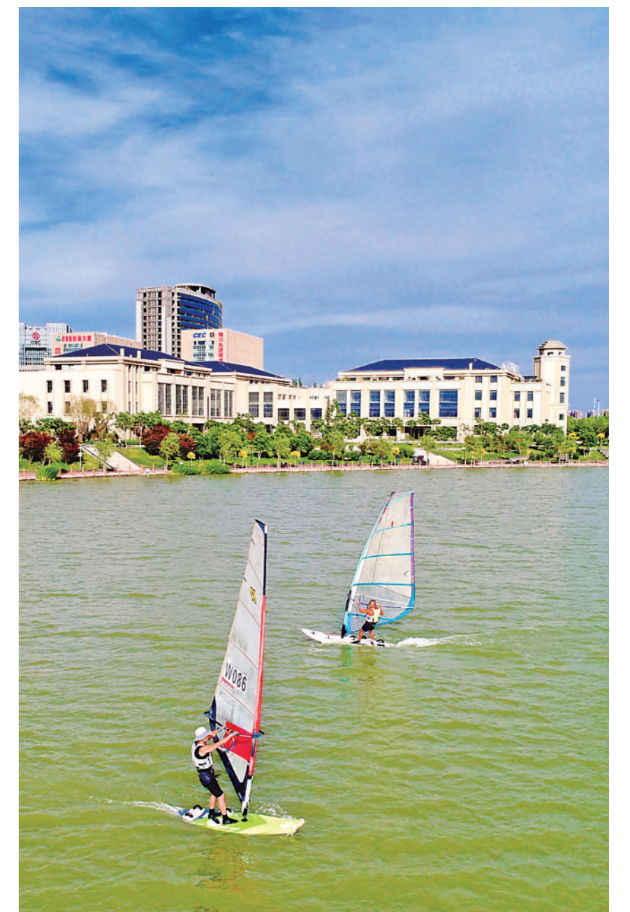
依黄河之利,银川拥有着广阔的水域,为市民健身娱乐提供了新领域。闽海湖上,两位帆板爱好者乘着夏日微风自由滑翔在碧波上。