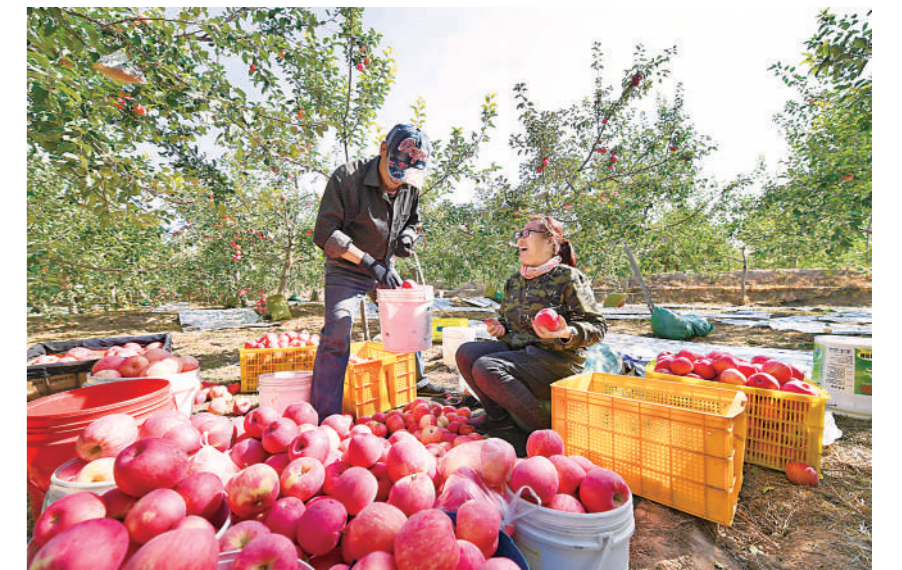
中卫市沙坡头区永康镇永乐村,村民在分享丰收的喜悦。这个昔日的贫困村,依靠发展特色产业走上致富路。