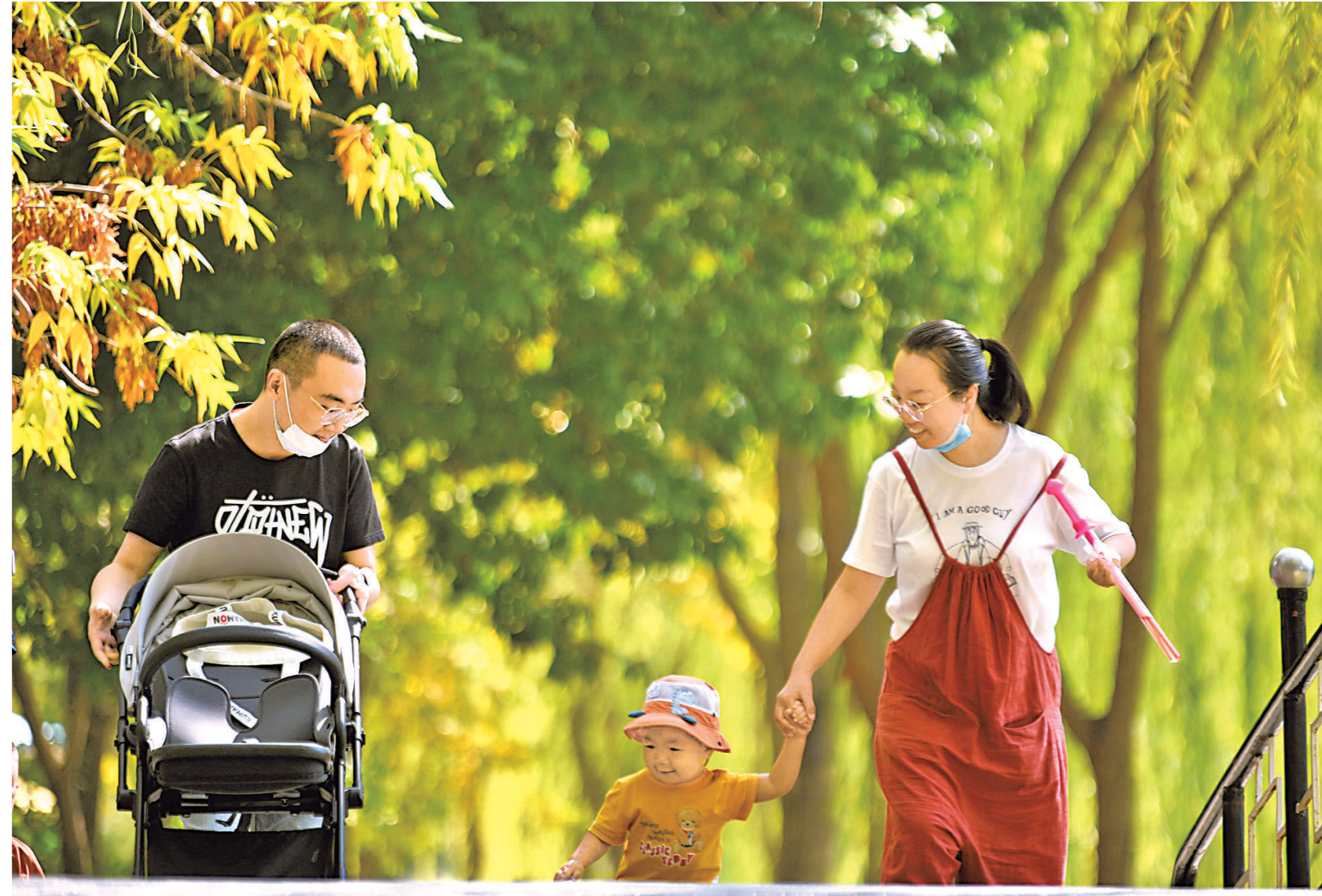
银川中山公园,年轻的妈妈牵着蹒跚学步的孩子。公园内繁花似锦,绿树成荫,节假日市民在这里游园、赏景,无限接近大自然,共享美好时光。