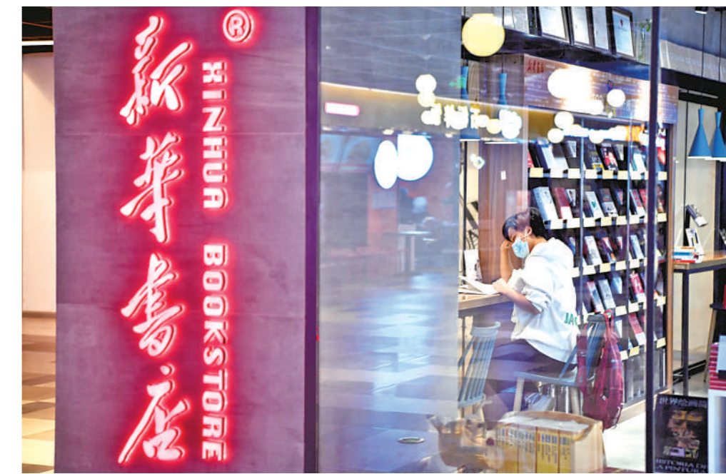
越来越多的书店、图书馆和文化馆现身宁夏城乡,不断满足人们精神生活的需要。