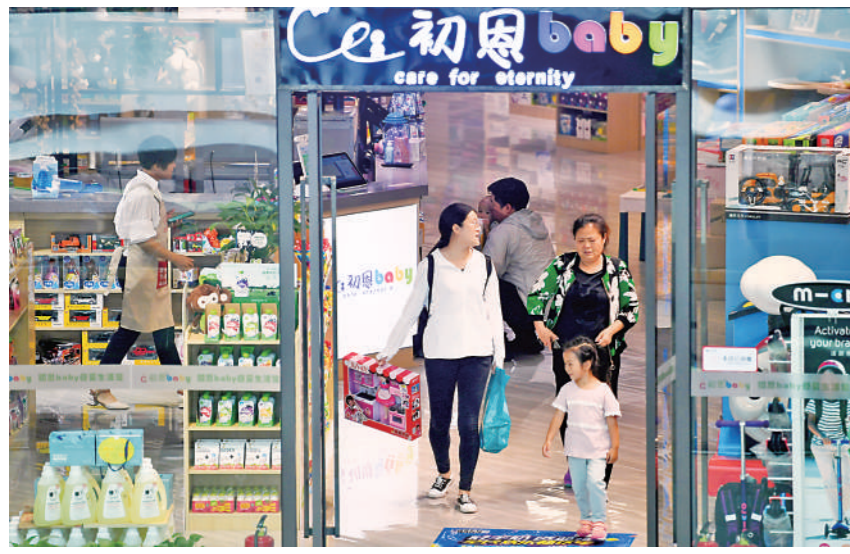
现代化商圈让银川成为区域时尚生活消费的主要目的地之一。