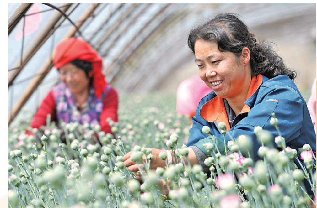
石嘴山市大武口区龙泉村积极探索农旅融合,大力发展花卉等产业,助力农民增收致富。