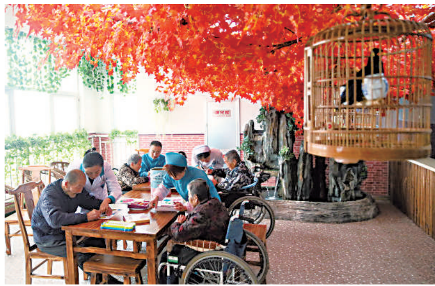
宁夏闽海养老中心,老人们在护理人员的悉心照顾下安享晚年生活。