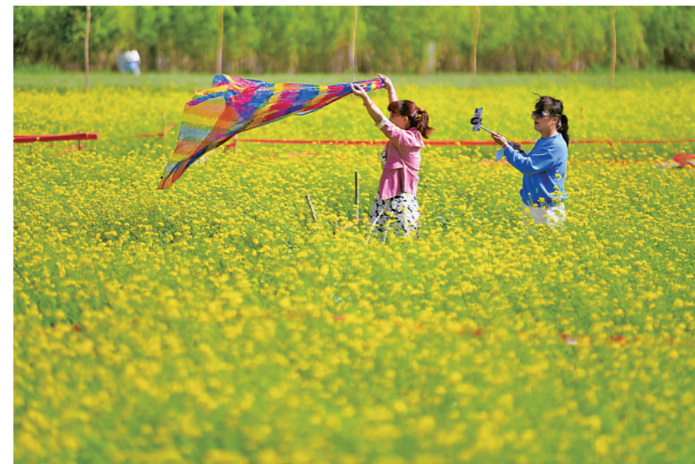
永宁县杨和镇王太堡生态农业观光园内,游客在油菜花田里拍照。为壮大村集体经济,摘掉“空壳村”的帽子,两年前该村打造了生态农业观光园,不仅富了乡亲,还为城里人假日旅游提供了好去处。