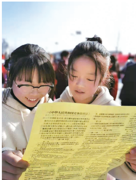
引导青少年积极学法自觉守法。

区全部配备公共法律服务智能化服务一体机,实现群众法律服务咨询智能化、科技化,真正打通群众法律服务最后一公里,公共法律服务更加多元化、均等化。5年来,共办结法律援助案件2173件(含公证案件927件),为当事人挽回经济损失2656万元。