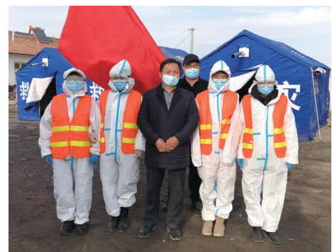
落实疫情防控责任。

根据疫情防控工作要求,先后组织召开疫情防控工作会议8次,推动各项任务落地落实。重新修订红寺堡区司法局疫情防控处置预案,完善沟通协调机制。严格落实领导带班制,全面做好24小时值班值守,确保突发情况信息报送及时准确、应急指挥畅通高效,应急物资供应准备充足。严格落实包片责任区疫情防控责任,抽调精干力量,集中开展对责任区域内住户户摸排登记工作,同时通过在小区张贴通知及宣传海报、入户宣传防疫政策等方式进行疫情防控知识宣传,筑牢织密疫情防控网。积极响应疫情防控指挥部命令,2021年疫情防控期间,红寺堡区司法局承担了石炭沟疫情防控卡点24小时值班值守任务,由分管副局长带队,抽调局机关及司法所20人,组建4个卡点值守专班迅速开展工作,圆满完成了值班值守工作任务。