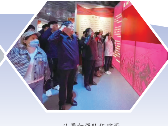
从严加强队伍建设。