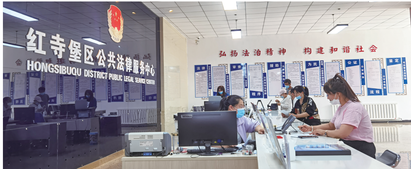
覆盖城乡、便捷高效的公共法律服务。