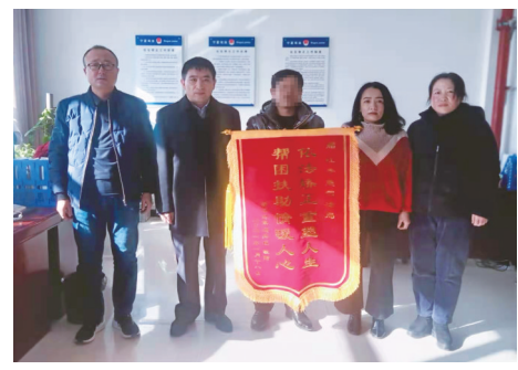
提升社区矫正质效。