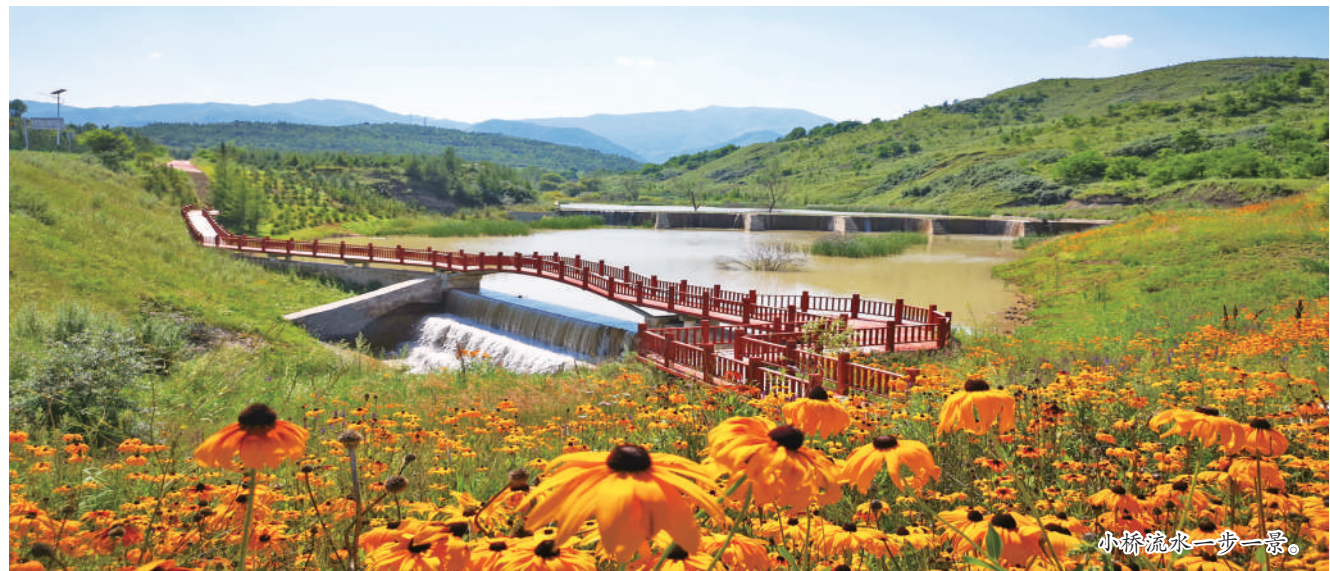
小桥流水一步一景

如今，“南北双线、两带四区”精品旅游线路已形成，初步形成了以精品景区为核心，以乡村旅游和新业态项目为支撑的全域旅游发展格局。