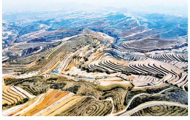
高标准农田稳产增收。