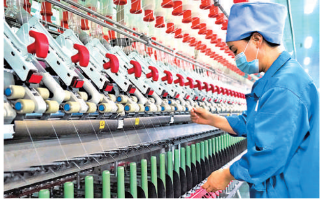
纺织产业带动就业。