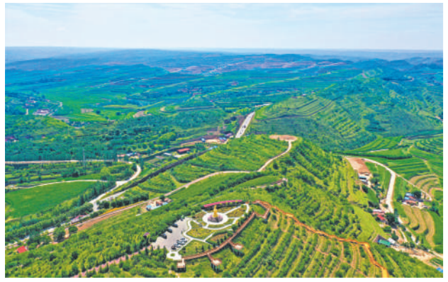
生态治理一张蓝图绘到底。