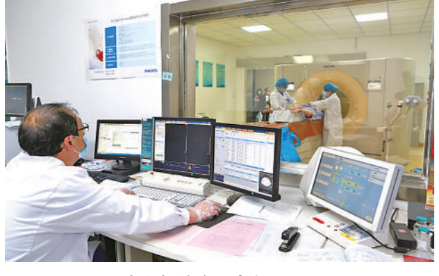
“互联网+医疗健康”城乡全覆盖。