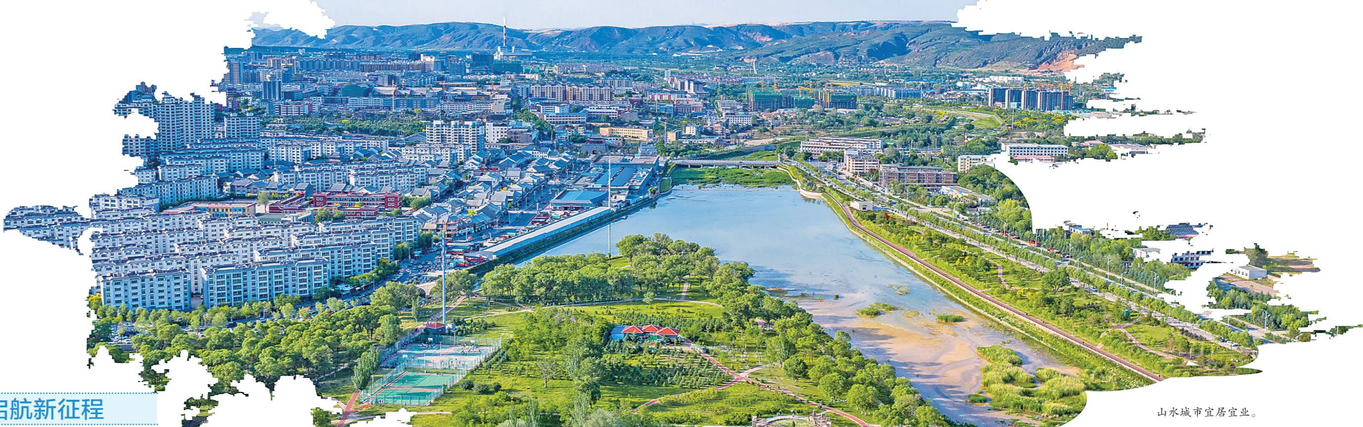
山水城市宜居宜业。