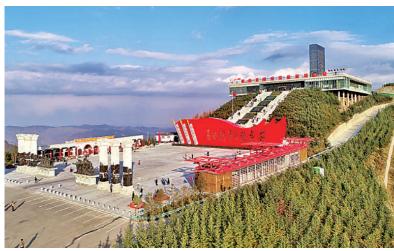
六盘山红军长征纪念馆争创国家5A级旅游景区。

助力纾困与激发活力并举,出台“六保”23条等一批举措,清欠民营企业账款19.2亿元,减免各类税费43.9亿元,降低社保费率等4.4亿元,67.1亿元财政直达资金惠企利民,帮助企业和个体工商户渡过难关,各类市场主体达到9.4万户,增长1.4倍。