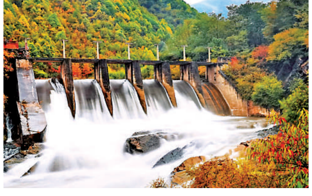
“五河共治”得芳华盛。