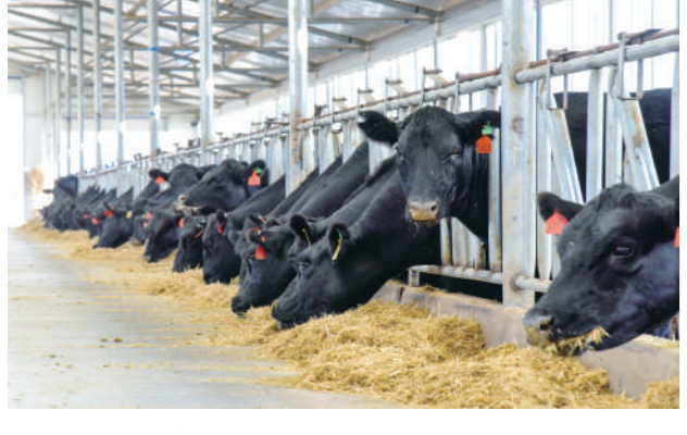
肉牛产业蓬勃发展的。

夏季的六盘山秀美如画,生机盎然。2016年7月18日至20日,习近平总书记视察宁夏,在西吉县将台堡红军长征会师纪念馆、泾源县大湾乡杨岭村、原州区彭堡镇姚磨村留下足迹。