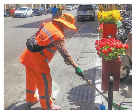
环卫工人在烈日下工作。

的劳动者能享受到哪些权益呢？自治区人力资源和社会保障厅相关负责人介绍，依据《自治区人力资源和社会保障厅关于调整全区高温津贴标准和发放范围的通知》，对于存在高温作业及在高温天气期间安排职工工作的全区企业、事业