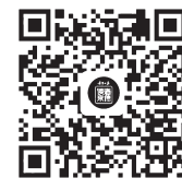
扫码进入宁夏日报读者来信微信公众号