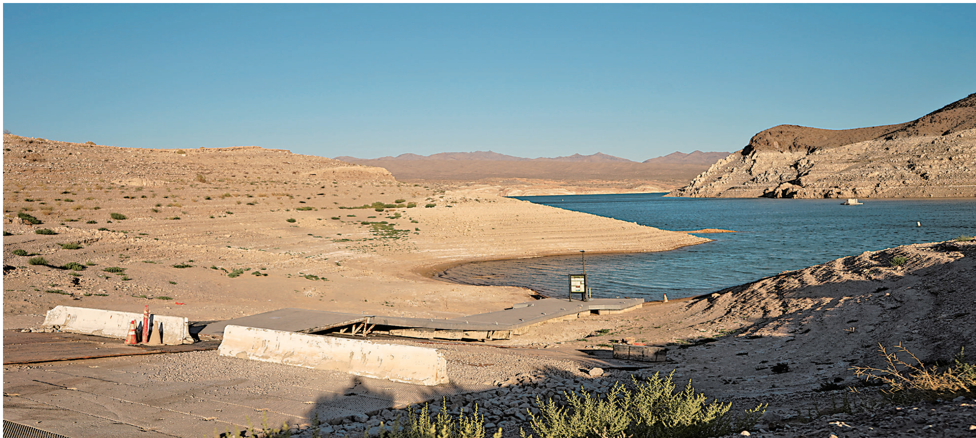
美国西部地区今年遭遇严重干旱,西部河流和湖泊水位近来急剧下降,其中包括美国最大的水库米德湖。这是7月5日在美国内华达州埃科贝附近拍摄的米德湖。

张军说,安理会第2585号决议关于对叙利亚人道救援的授权将于7月10日到期。中方对安理会当天在叙利亚跨境人道救援授权延期问题上未能达成共识表示遗憾。中方呼吁各方不要放弃努力,继续协商,增进互信,展现更大灵活,就到期后的安排寻找切实可行的方案。