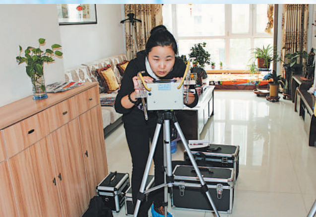
宁夏计量质量检验检测研究院检验员在居民家中检测空气质量。