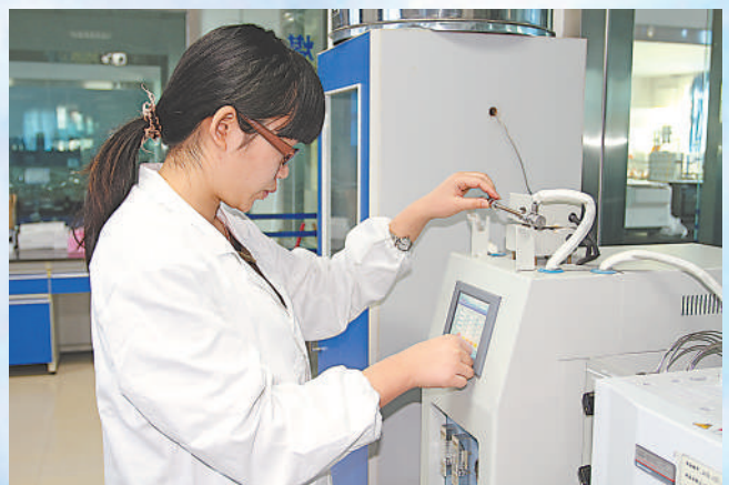
宁夏计量质量检验检测研究院检验员在进行室内空气采样检测。