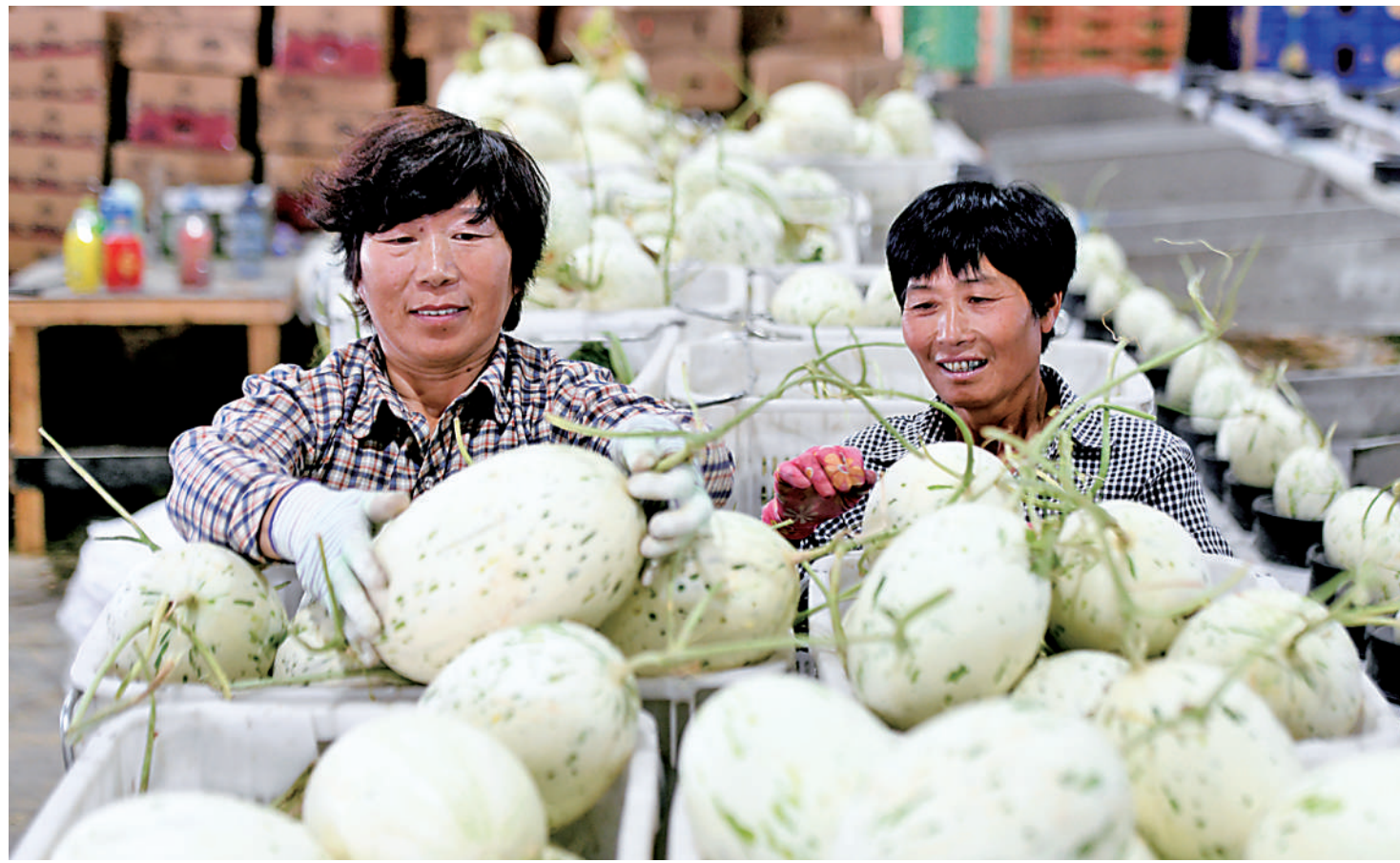
7月20日,银川市兴庆区月牙湖乡千亩蜜瓜种植基地,工人们在车间内分拣包装成熟的流星蜜瓜。今年,月牙湖乡千亩蜜瓜种植基地年产量预计达2亿元,在有效推进当地一二三产业融合发展的同时,实现农民增收致富。