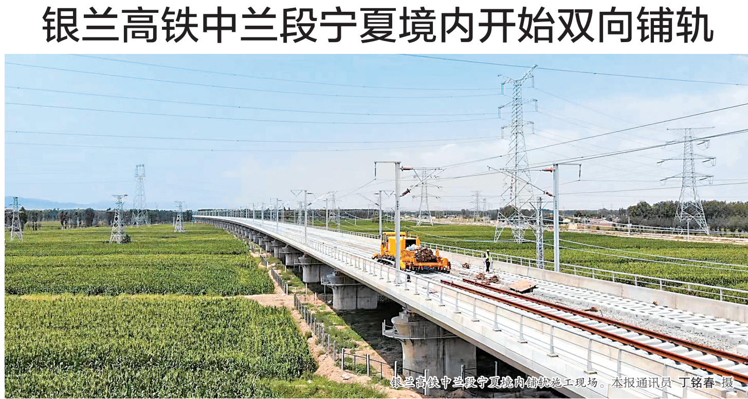
银兰高铁中兰段宁夏境内铺轨施工现场。

本报讯（记者 陈瑶 赵磊 实习生 朱子旭）8月4日，银兰高铁中兰段宁夏境内铺轨施工开始双向铺轨，预计今年年底通车。 新建的银兰高铁中兰段，北起宁夏中卫市，向南经甘肃省白银市（平川区、靖远县、白银区）及兰州市（皋兰县、兰州新区），引入中川城际树屏站。正线全长219.976公里，其中宁夏境内线路长46.249公里，设计速度为每小时250公里。 “今年3月，我们从甘宁省界向中卫南站方向铺轨。”中国铁建大桥工程局集团有限公司项目技术负责人介绍，目前已经单向由甘宁省界至香山隧道共铺设36.32公里。此次开始自中卫南站至香山隧道方向铺设。 为加快铺轨进度，中国铁建大桥局全力推进疫情防控和施工生产“两手抓”，不断优化方案和资源配置，通过创新施工工艺、改进机械设备等手段，实行机械化、自动化铺轨，极大地提高了施工效率。 银兰高铁中兰段是我国“八纵八横”铁路网京呼银兰通道的重要组成部分，建成通车后将作为我国西北地区连接华北、东北地区的快速客运通道。届时，中卫至兰州列车运行时间将由现在的5个小时缩短到1个小时左右。