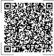
扫码观看新闻视频

情外溢扩散。要运用大数据等现代科技手段精准流调溯源，全面排查死角漏洞，把所有密接和次密接人员全部找到、一个不少，确保精准施策、精准防控。要扎实做好应急处置指挥调度、人员力量调配、物资供应保障等工作，对外地在沙坡头区的旅游人员，要加强教育引导、心理疏导，努力提供精心周到的生活服务，让大家安心放心，支持配合防控工作。要及时召开新闻发布会，通报疫情防控工作情况，及时回应社会关切，引导群众坚定信心、共战疫情。 会议以视频形式召开，自治区领导艾俊涛、雷东生、李金科、买彦州、赵旭辉、王刚在主会场参加，赵永清在中卫分会场参加。