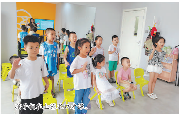
孩子们在上艺术口才课。