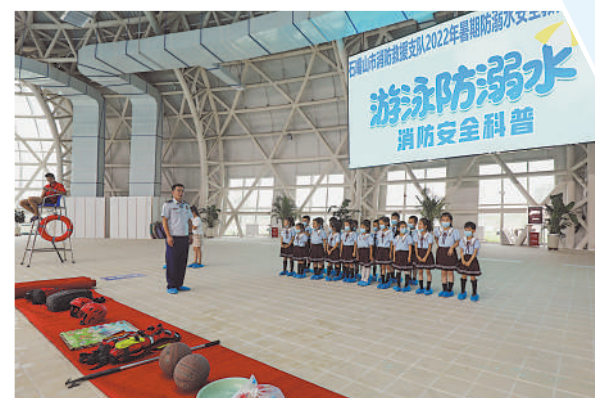
石嘴山市消防救援支队开展防溺水安全宣传。

近日,我区就防溺水工作进行安排部署,要求全区各中小学高度重视防溺水工作宣传力度,杜绝溺水事故的发生。