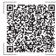
扫码观看新闻视频