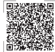
扫码观看白皮书全文