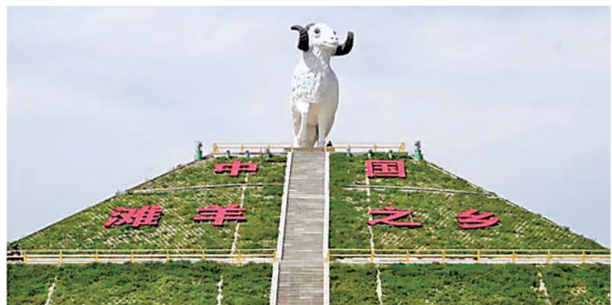
在青银高速公路宁夏段盐池收费站不远处,一座滩羊雕像引人注目。