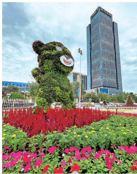
↑ 别样的花卉造型惹人注目。