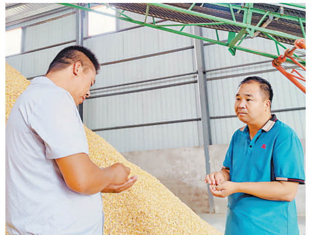
金刚(右)在查看谷物品质。

9月1日上午,被中共中央、国务院授予全国“人民满意的公务员”称号的石嘴山市惠农区礼和乡党委书记金刚载誉归来。