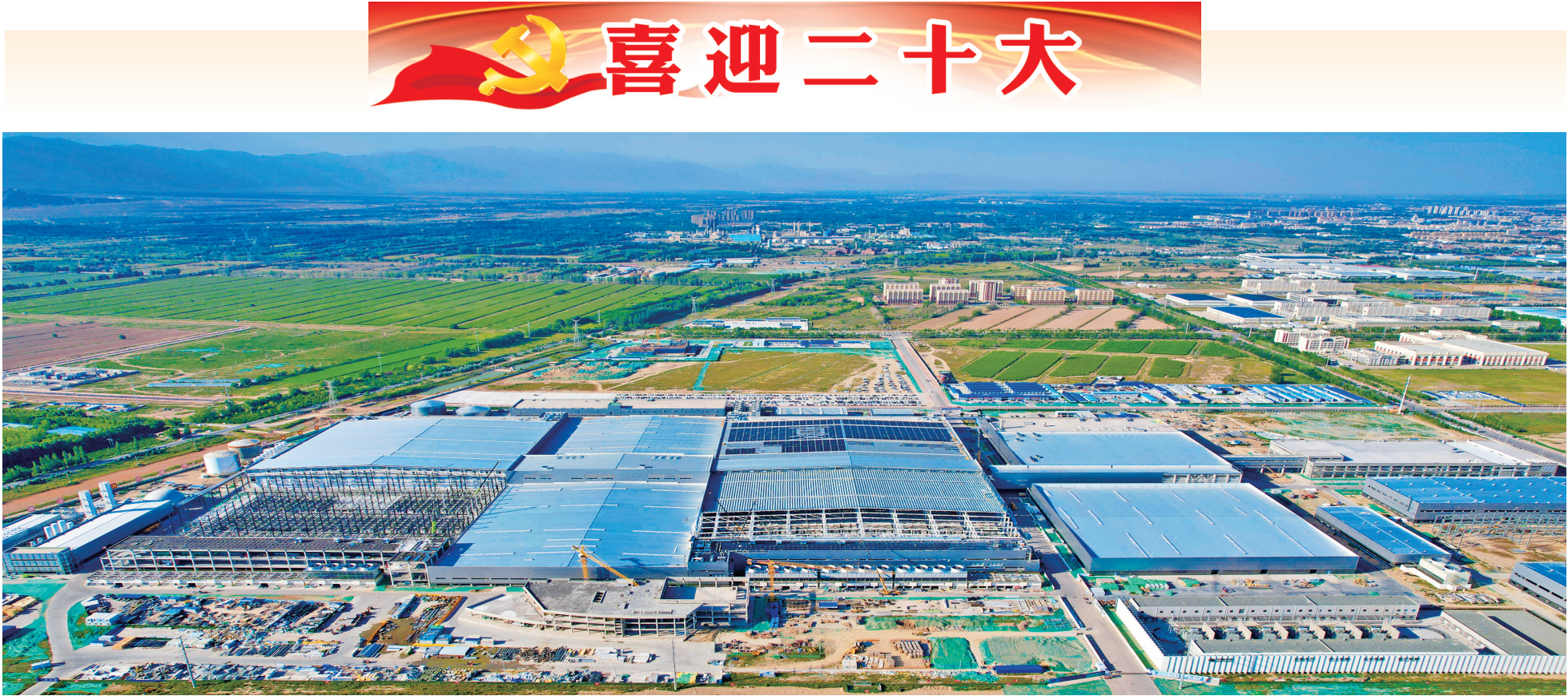
9月14日,宁夏中环光伏材料公司50GW(G12)太阳能级单晶硅材料智慧工厂及相关配套产业项目建设正酣,项目整体已具雏形。据了解,宁夏中环太阳能级单晶硅材料智慧工厂项目总投资约150亿元,占地800亩,建筑面积43.9万平方米,计划安装3072台单晶炉、120台载新机、100台开方机等配套设备,采用工业4.0技术和全球领先的智慧工厂模式进行建设,该项目是银川经济技术开发区成立20年来单体投资最大的制造业项目。

补助等,收入不算少。”梁言顺听了高兴地说,大家赶上了好时候,房子宽敞明亮,收入稳定有保障,说明各项帮扶政策落实了、见效了,我们还要一起继续努力,把日子越过越好。 梁言顺最后强调,总书记对巩固拓展脱贫攻坚成果高度重视、盯得很紧。我们各级党委和政府必须坚定担当起这份政治责任,把增加脱贫人口收入作为重中之重来抓,把脱贫攻坚的后续工作做深入做细致,该帮扶的尽力帮扶,切实让脱贫人口的收入有实质性增长,确保共同富裕道路上一个都不掉队。 自治区领导陈雍、雷东生、马汉成、陈春平参加。