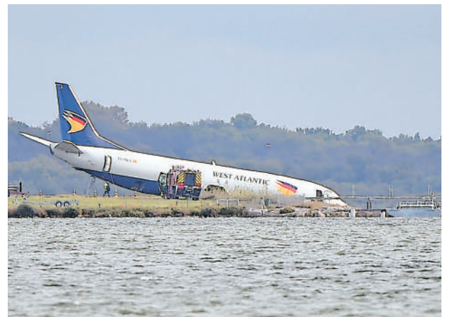
这是9月24日拍摄的滑出法国蒙彼利埃机场跑道的货机。西大西洋货运航空公司一架波音737货机24日凌晨降落法国蒙彼利埃机场时滑出跑道,机头扎进附近湖中,所幸没有人员伤亡。受此影响,蒙彼利埃机场临时关闭。

新华社首尔9月25日电 韩国联合参谋本部25日说,朝鲜当天向朝鲜半岛东部海域方向发射一枚短程弹道导弹。 韩国联合参谋本部当天通过短信向媒体发布消息说,导弹于当地时间6时53分(北京时间5时53分)从朝鲜平安北道一带发射,韩军将加强监视警戒。