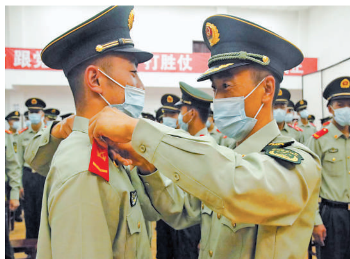
10月1日,武警银川支队举行警士、义务兵晋升警衔仪式,进一步激发广大新晋警士的荣誉感、责任感、使命感。